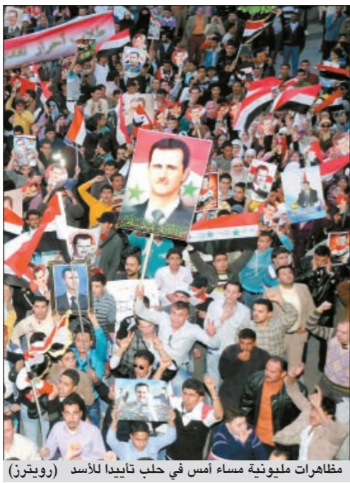
مظاهرات مليونية مساء أمس في حلب تأييداً للأسد

دمشق - وكالات: وسط ترقب الشارع السوري لموعد تنفيذ الوعد التي قطعتها القيادة السورية وللأوضاع في اللاذقية ودراعا، أعلنت نخبة شعبان مستشارة الرئيس السوري لوكالة فرانس برس أمس أن السلطات السورية قد اتخذت قرار رفع قانون الطوارئ، ولم تحدد موعداً لإعلانه، لكن قناة العربية نقلت عن مصادر سورية ان الإعلان عنه سيتم بعد انجاز قانون مكافحة الإرهاب، وتوقعت أن تقدم الحكومة السورية استقالته غداً «اعترافاً منها بالتقصير في تلبية هموم المواطنين». في هذه الأثناء أجرى صاحب السمو الأمير الشيخ صباح الأحمد اتصالاً هاتفياً بالرئيس السوري د.بشار الأسد أبلغه فيه بدعم الكويت لسورية في وجه «محاولات زعزعة أمنها»، وفي غضون ذلك، عززت قوات الجيش وجودها في مدينتي درعا واللاذقية اللتين شهدتا اضطرابات عنيفة أمس الأول، فيما أفرجت السلطات الأمنية عن 17 معتقلاً سياسياً.