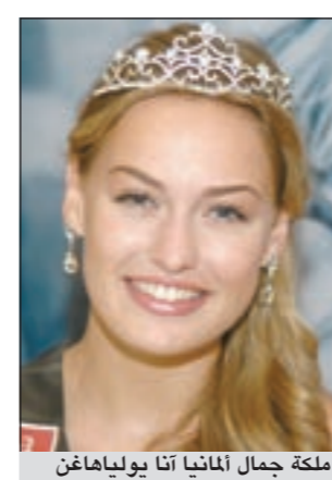
ملكة جمال ألمانيا آنا يولياهاغن

ملكة جمال ألمانيا آنا يولياهاغن لـ «الأنباء»: لماذا لا تكون للكويت ملكة جمال؟