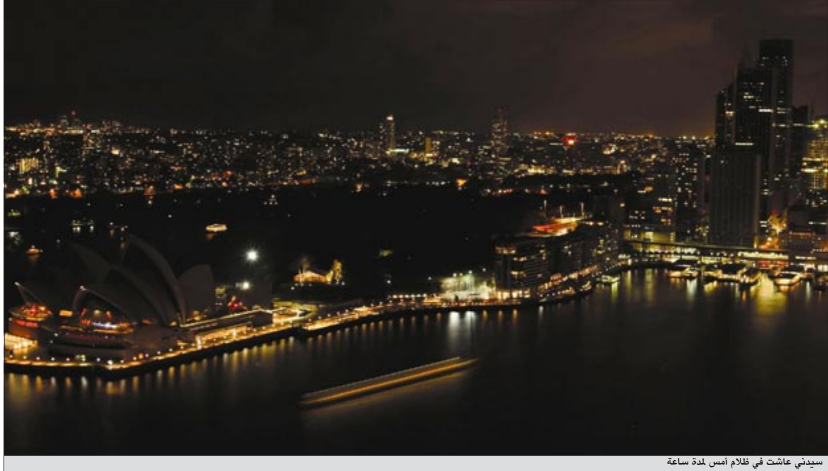
سيدني عاشت في ظلام أمس لمدة ساعة

وختم يقول «لم نتصور في البداية ان التحرك سيكون على النطاق الواسع الذي هو عليه الآن. وكذلك لم تكن نتوقع