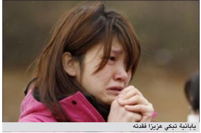
يابانية تبكي عزيزاً فقدته

غير ان وكالة الامان النووي قالت اليوم ان درجة الحرارة والضغط في جميع المفاعلات قد استقرت.