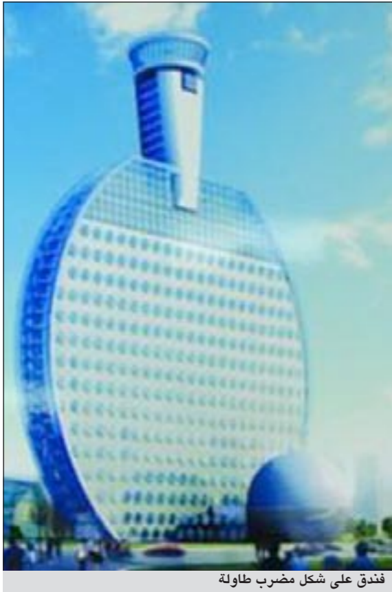
فندق على شكل مضرب طاولة

بكين - وكالات: صحیح ان اسم كرة الطاولة ارتبط بالصين حيث ان اللاعبين الصينيين ابدعوا فيها وياتوا مرجعا لهذه الرياضة، وادخلوا اليها حركات وتقنيات جديدة لا يمكن لأحد منافستهم فيها. إلا ان التعلق بهذه الرياضة تحول الى هوس على ما يبدو، إذ تعزز إحدى المدن الواقعة في مقاطعة انهوي بشرق الصين، تشييد فندق على شكل مضرب كرة الطاولة. ومن المتوقع أن يبلغ ارتفاع الفندق 150 متراً وسيشيد داخل مجمع رياضي، وسيزود بمقبض في الأعلى وكرة صغيرة تشبه كرة الطاولة بجانبه، كما سينضم تزويد الفندق بـ 3 ملاعب على شكل كرة قدم وكرة سلة والكرة الطائرة، بجانب ملعب آخر مكشوف على شكل كرة ركني مفتوحة من النصف.