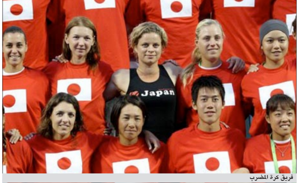
فريق كرة المضرب

أخرى تعهدت بها بعض الاطراف الراعية. ومن المتوقع أن تسلم هذه الحساب وعود بتبرعات جرت عبر الهاتف أو الإنترنت بالإضافة إلى