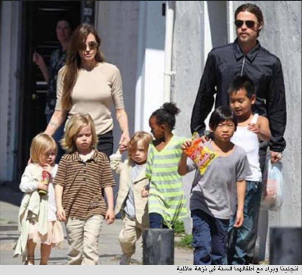
أنجلينا وبراد مع أطفالهما الستة في نزهة عائلية