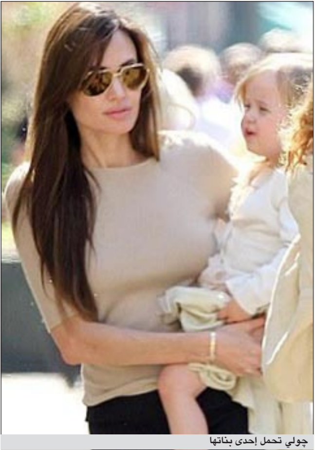
جولي تحمل إحدى بناتها

خرج ثنائي هوليوود براد بيت وأنجلينا جولي صباح الأحد 20 الجاري مع أطفالهما الـ 6 لشراء البقالة في مدينة نيو أورلينز بولاية لويزيانا. ونشر موقع «دائلي ميل» الصور، التي ظهرت فيها العائلة كلها بأفرادها الـ 8 والابتسام تملأ وجوههم وهم في طريقهم الى «بيرتي ماركت» وحسب ما نشرته مجلة «بيبول»، فإن شاهد عيان قال ان الثنائي الذهبي دخل الماركت لشراء العصير والبطاطس وبعض الحلوى لأطفالهما، وان ما يهمهما هو ان يقضوا الوقت مع أطفالهما ذهابا وإيابا الى اي مكان.