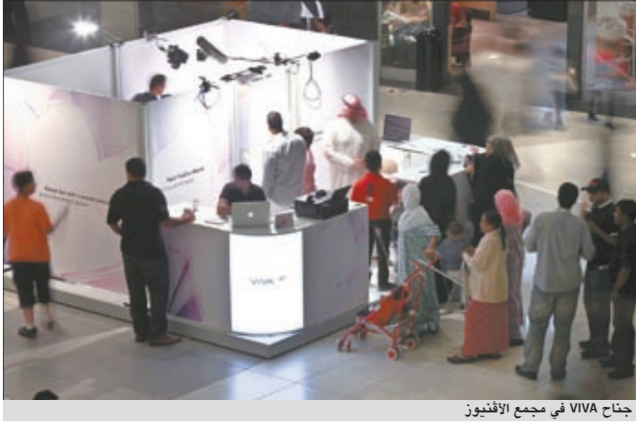
جناح VIVA في مجمع الأفيون

منذ انطلاقها. وعن هذه الطريقة المتكررة في تهنئة الأمهات، قال الحوطي: «لقد ابتعدنا عن الطرق التقليدية واتحنا الفرصة لتهنئة الأمهات بطرق حديثة ومبتكرة، وكنا السابقين في هذا المجال في الكويت».