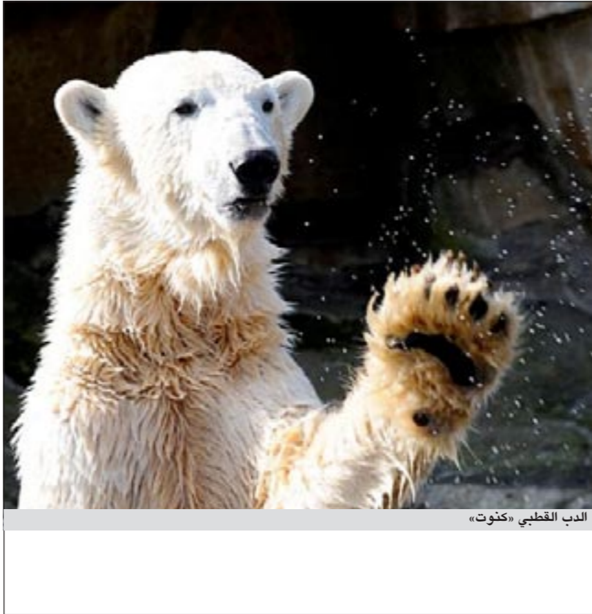
الدب القطبي «كنوت»

كما كشف أن 36 ألف شخص من المنطقة يلتحقون بشبكة «فيس بوك» يوميا وتم في هذه المنطقة مشاهدة 100 مليون فيديو «يوتيوب» يوميا. وأورد مدير قسم الهندسة في الشرق الاوسط وشمال أفريقيا في شركة «غوغل» أحمد حمزاوي مجموعة احصاءات عن المنطقة من بينها ان الاخبار تليها الصور والموسيقى في أبرز المنتجات التي يتم البحث عنها بواسطة محرك غوغل للبحث. وقال ان منطقة الشرق الاوسط وشمال أفريقيا تتفوق على الاسواق الاخرى لجهة البحث عن الاخبار وتشكيل المجموعات على الانترنت والرياضة. وأشار إلى ان أهم المواقع التي يزورها المستخدمون في العام 2011 هي على التوالي: فيس بوك وتوتوب ويكيبيديا.