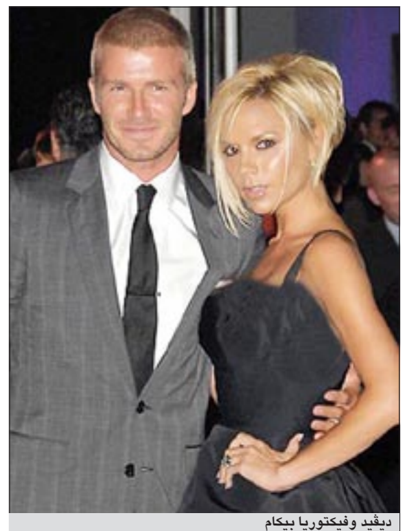
ديفيد وفيتوريا بيكام

لوس انجليس - رويترز: ينتظر الزوجان البريطانيان الشهيران ديفيد وفيتوريا بيكام مولوداً جديدة تضاف إلى ابناؤهما البنين الثلاثة الذين يتمتعون بالحوية. وكان الزوجان قد أعلنتا في يناير كانون الثاني انهما ينتظران مولودا جديدا، وقال لاعب خط وسط نادي لوس انجليس جالاسكي لكرة القدم أثناء غداء في لوس انجليس «بالتأكيد نحن محظوظون جدا لانتظارنا مولودا مرة أخرى وهذه هي اول مرة التي اقول فيها.. انها طفلة». ولنجم الرياضة الانجليزي (35 عاما) وزوجته المغنية التي تحولت إلى مصممة ازياء (36 عاما) ثلاثة اولاد هم بروكلي (12 عاما) وروميو (8 اعوام) وكروز (6 اعوام). وستضع فيكتوريا مولودتها في يوليو.