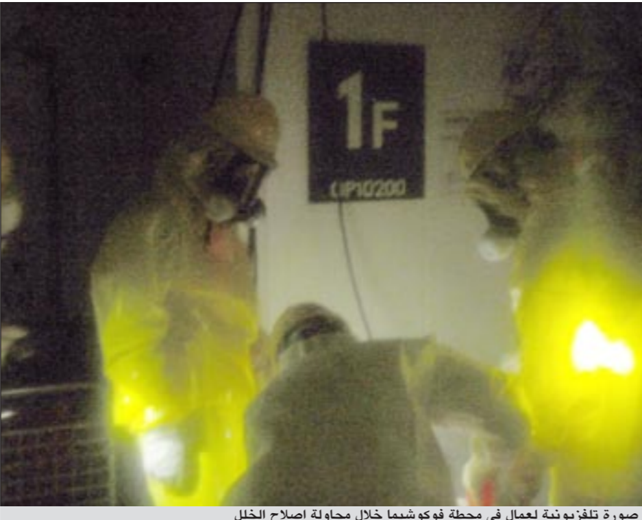
صورة تلفزيونية لعمال في محطة فوكوشيما خلال محاولة إصلاح الخلل

طوكيو حيث يعيش 35 مليون شخص في الخارج أيضاً. ومنع بيع بعض الخضار والحليب في أربع مناطق على الأقل حول محطة فوكوشيما بينما نصحت السلطات بعدم استخدام مياه الصنابير للأطفال الصغار في نحو 12 بلدة حول العاصمة. وامتد الخوف من الإشعاعات إلى الخارج أيضاً، ويعد الولايات المتحدة وأستراليا وكندا وروسيا والصين وكوريا الجنوبية، فرضت دول أخرى في آسيا والبلدان الـ 27 الأعضاء في الاتحاد الأوروبي عمليات مراقبة على المنتجات الطازجة التي مصدرها شمال شرق اليابان والتي لم يعد لديها أسواق في الخارج عملياً. وفي مؤشر إلى القلق المتزايد، ادخل يابانيان يتحدران من مناطق تقع في شريط يبعد بين 200 و350 كلم عن المحطة، إلى المستشفى لفترة قصيرة الأربعة الماضي بعيد وصولهما إلى الصين على متن رحلة تجارية من طوكيو نظراً لاصابتهما بمستويات عالية من الإشعاعات. وفي شمال شرق اليابان حيث يستمر البرد وتهطل الثلوج، يواصل رجال الإنقاذ دفن جثث مئات القتلى بعد التعرف عليهم من قبل عائلاتهم، دون أن تتمكن من احراقها بسبب نقص الوقود.