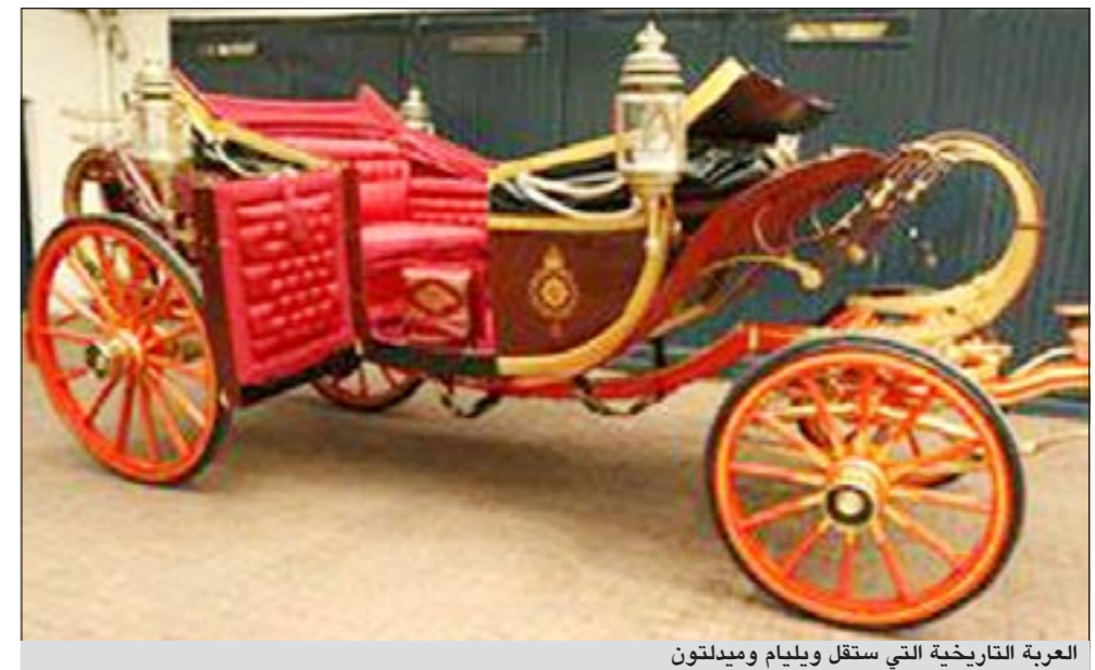
العربة التاريخية التي ستقل ويليام وميدلتون

باريس - أ.ش.أ: يمثل فرنسي يبلغ من العمر 32 عاماً أمام محكمة جنح تولوز يوم 6 أبريل القادم بتهمة انتهاك الحرمات الشخصية لأكثر من 600 فتاة وامرأة بعد أن قام بتصويرهن بتلفونه المحمول في أحد المحلات التجارية الكبرى في مدينة تولوز الفرنسية. وذكرت مجلة «لوبوان» الفرنسية أن رجال الأمن في هذا المحل التجاري الكبير لاحظوا أكثر من مرة اقتراب هذا الرجل من السيدات والفتيات اللاتي يرتدين الجيبات القصيرة قبل أن يقوم بإزالة محموله إلى أسفل ليقيم بتصوير أجسادهن من الداخل. وفوجئ رجال الأمن وهم يجردون الرجل من محموله بأنه يحتوي على أكثر من 600 صورة وفيديو لهؤلاء السيدات والفتيات.