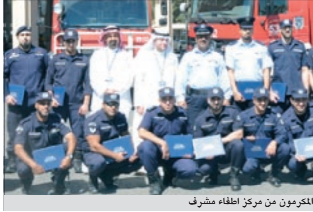
المكرم من مركز اطفاء مشرف

انشطة يوم رجل الاطفاء تركزت هذا العام على مخاطبة الطفل وذوي الاحتياجات الخاصة والعمالة المنزلية وبمشاركة العديد من الجهات الحكومية مثل الحرس الوطني واطفاء الجيش بالإضافة إلى رجال الإطفاء وكذلك الجهات الخاصة وتقديم الرعاية والهدايا مثل شراكات القطع النقطي وشركة اساس الدولية للخدمات التعليمية وشركات الكويت وغيرها وهذا بفضل