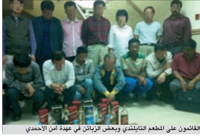
القائمون على الطعم التايلندي وبعض الزبائن في عهدة أمن الأحمد

المقدم غازي المطيري ومساعدته الرائد فالح الهزلي والرائد سلمان المطيري بانتظاره، مشيراً إلى أن رجال الأمن وكإجراء لاحق تمت مخاطبة البلدية لفحص الطعم والأطعمة لتظهر المفاجأة المدوية وهي أن معظم الأطعمة فاسدة وغير صالحة للاستهلاك الآدمي.