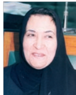
المستشارة وضحة المذكور

تحت اشراف الوزير المختص ادارة الجهاز التنفيذي طبقا لهذا القانون والقوانين الأخرى ويتولى على وجه الخصوص الأمور التالية: