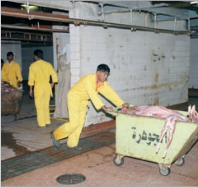
عملية إتلاف اللحوم الفاسدة

في إحصائية لجهود فرق التفتيش عن العام المنصرم