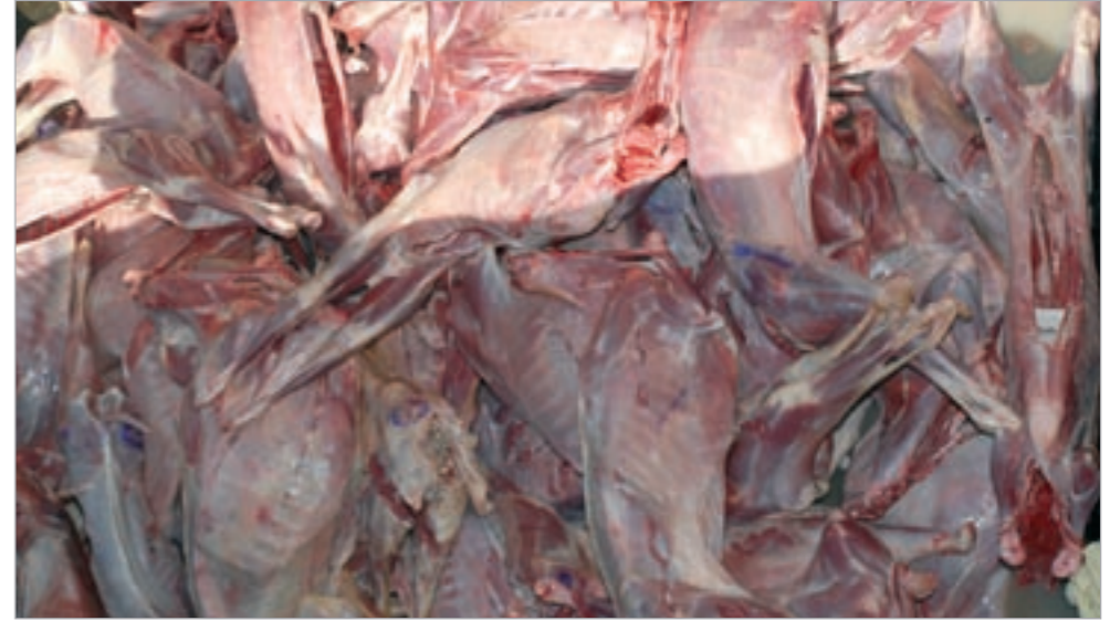
جانب من اللحوم الفاسدة