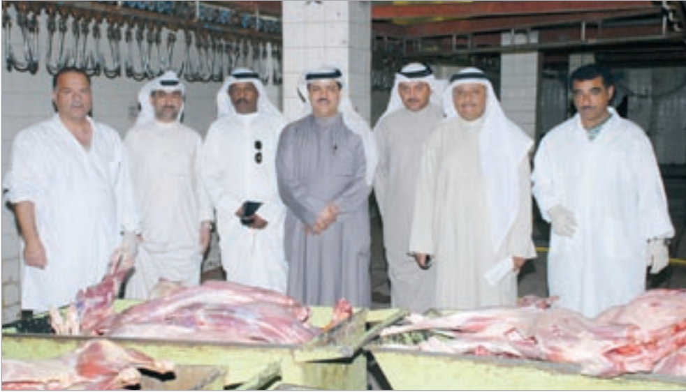
مفتشو العاصمة امام كمية من اللحوم المضبوطة