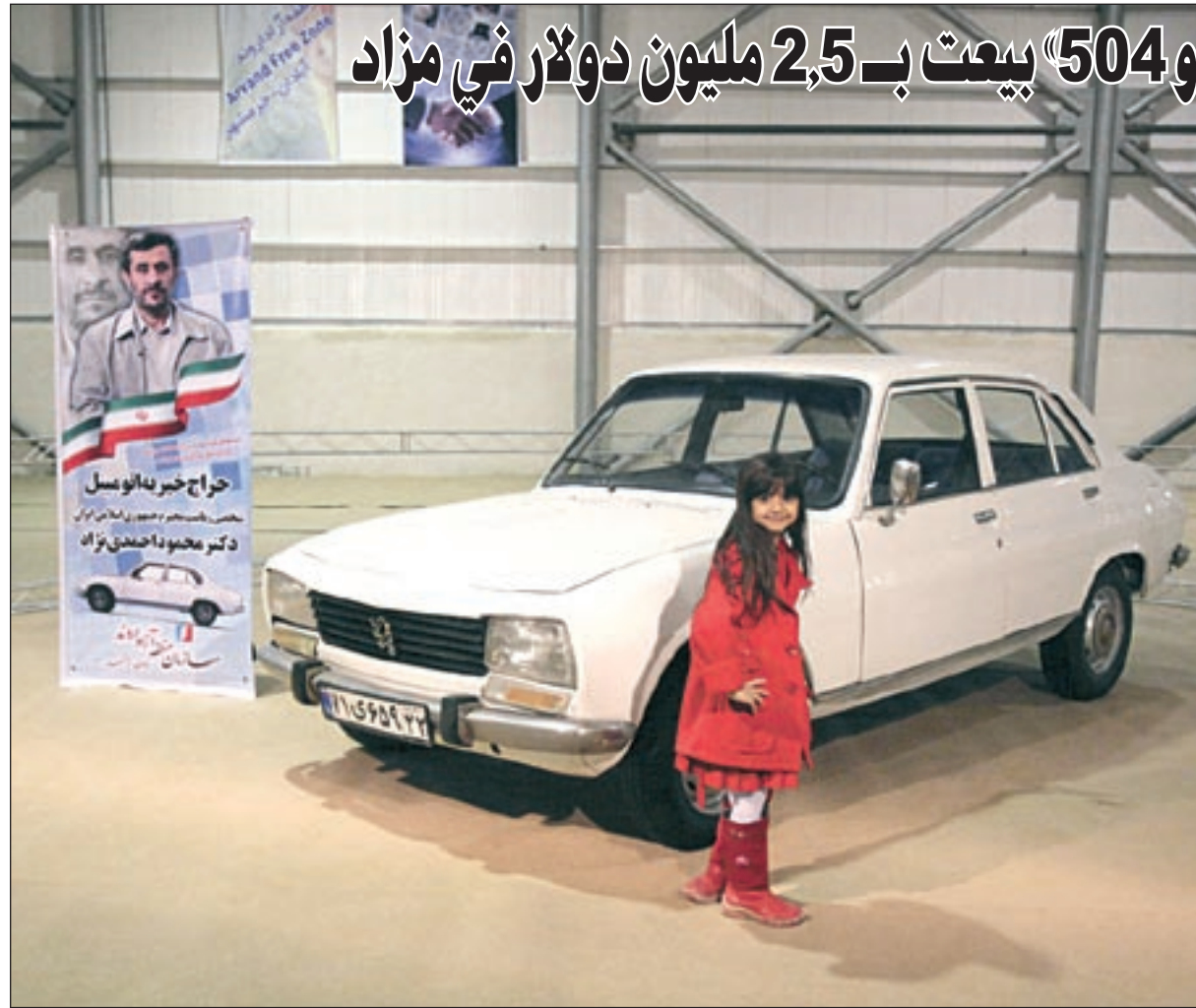
فتاة إيرانية تقف أمام سيارة نجاد الـ «بيجو 504» التي بيعت بمليون ونصف المليون دولار

طهران - أ.ف.ب: بيعت سيارة بيجو 504 قديمة يملكها الرئيس الإيراني محمود احمددي نجاد بمبلغ 2,5 مليون دولار بعدما عرضت في مزاد علني لجمع الأموال لمشروع مخصص للمحرومين على ما جاء في الموقع الإلكتروني للمنظمة الإيرانية للمساعدة الاجتماعية.