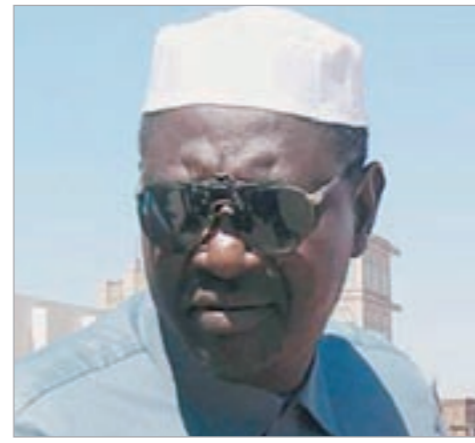
عبد الملك أوباما

وأعرب عن ترحيبه بتعاون الندوة العالمية للشباب الإسلامي مع «مؤسسة باراك أوباما الخيرية» والتنسيق معها في كل ما يخدم الشباب والارتقاء بهم في جميع المجالات الحيوية.