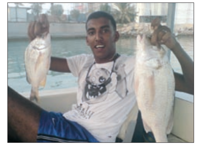
النقرور والشعم يا سلام

ما افضل اماكن تواجد أسماك النقرور والسببتي والشعم؟ بالنسبة للنقرور فافضل اماكن تواجده تكون بالدقان والارياق والطبعانات والركسة ويأتي تواجد النقرور بهذه الاماكن على فترات متفاوتة سواء كان بالليل او النهار وبأشهر مختلفة، باختصار صاحب الخبرة والممارسة هو الذي يختار الوقت المناسب لاماكن النقرور ووقت صيده، اما بالنسبة للسببتي فافضل اماكنه تكون بالاسياق الشمالي وبالحيشان، اما بالنسبة للشعم الشتوي فافضل اماكنه تكون عند مداخل الصبية وجزيرة أم النمل وعلى اسياق بر اغضي. ما أكثر ما يضايقك بالبحر؟