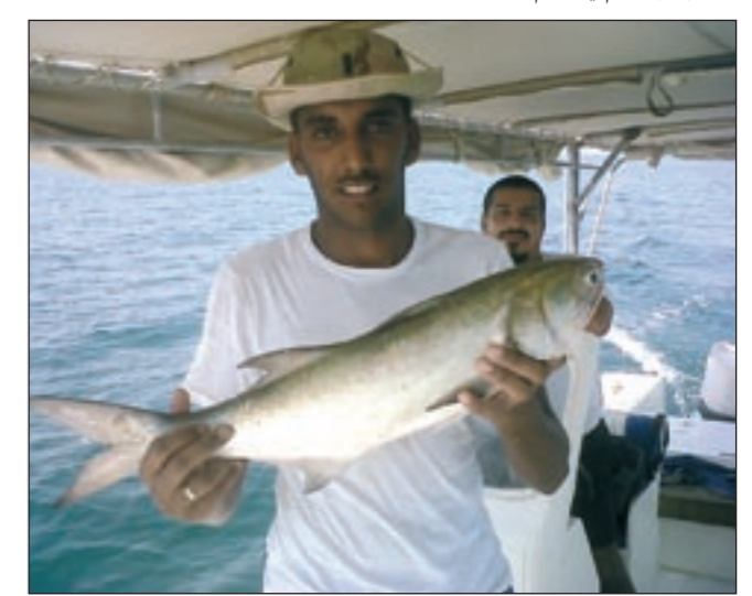
شوف الشيمة الطيبة