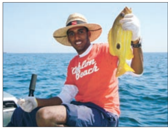
أسماك عمان الطيبة

صراحة الصيادين الوافدين الذين يقومون برمي العديد (شباك الصيد) وأصحاب المشايك والقراير وما يقوم به بعض الحداقة من رمي العلب والإكياس الفارغة بالبحر. ما نوع الليم الذي تستخدمه خلال رحلاتك البحرية؟ نوع الليم أولا يعتمد بالدرجة الأولى على المكان الذي تنوي الذهاب اليه وعلى السمكة التي ترغب فيها وأنا استخدم بيم الريبان والزوري والشريب والمصير والميد حق الحداق الشمالية وأستخدم بيم الخفاق والليواف والميد حق الحداق الجنوبية. ما حجم طرادك؟ في السابق كنت أمتلك طرادا بحجم 33 قدما وعليه ماكينتان بقوة 250 لكل واحدة، أما الآن فأمتلك طرادا بحجم 31 قدما وعليه ماكينتان بقوة 140 لكل واحدة.