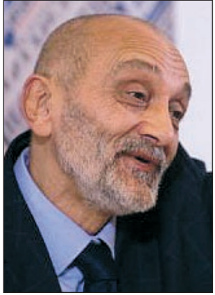
الباحث الإيطالي سيلفانو

روما - أ.ف.ب: أفاد باحثون إيطاليون متخصصون في كشف الألغاز الفنية بأن رجلاً شاباً وقف أمام ليوناردو دا فينشي خلال رسمه للوحة موناليزا وهي فرضية يشكك فيها خبراء متحف اللوفر. سيلفانو فينتشيني رئيس اللجنة الوطنية لتمكين الممتلكات التاريخية أكد أمام الصحافة الأجنبية في روما أن أحد مساعدي فنان النهضة الكبير يدعى سالاي كان الموديل في لوحة موناليزا الشهيرة. وسالاي واسمه الحقيقي جان جاكومو كابروتي بدأ العمل لدى الفنان في سن السادسة عشرة وبقي إلى جانبه 25 عاماً وكان ملهمه والموديل الذي استخدمه في العديد من لوحاته. وقال فينتشيني إن الرجلين كان يقومان علاقة «ملتزمة» وكانا على الأرجح عشيقين. وأشار فينتشيني إلى وجود نقاط تشابه كثيرة بين ملامح وجوه الأشخاص الوردتين في لوحة بوحنا المعمدان الملائك، مع استخدام انف وقم موناليزا. وقال الباحث إن الرسام ترك مؤشرات من خلال رسمه في عيني موناليزا حرفي لام وسريين في إشارة إلى ليوناردو وسالاي. وأوضح الباحث الذي وضع كتاباً حول هذا الموضوع أن فريقه ارتكز إلى تحليل لنسخ رقيقة عالية النوعية والدقة، إلا أن متحف اللوفر الذي يضم لوحة موناليزا شكك