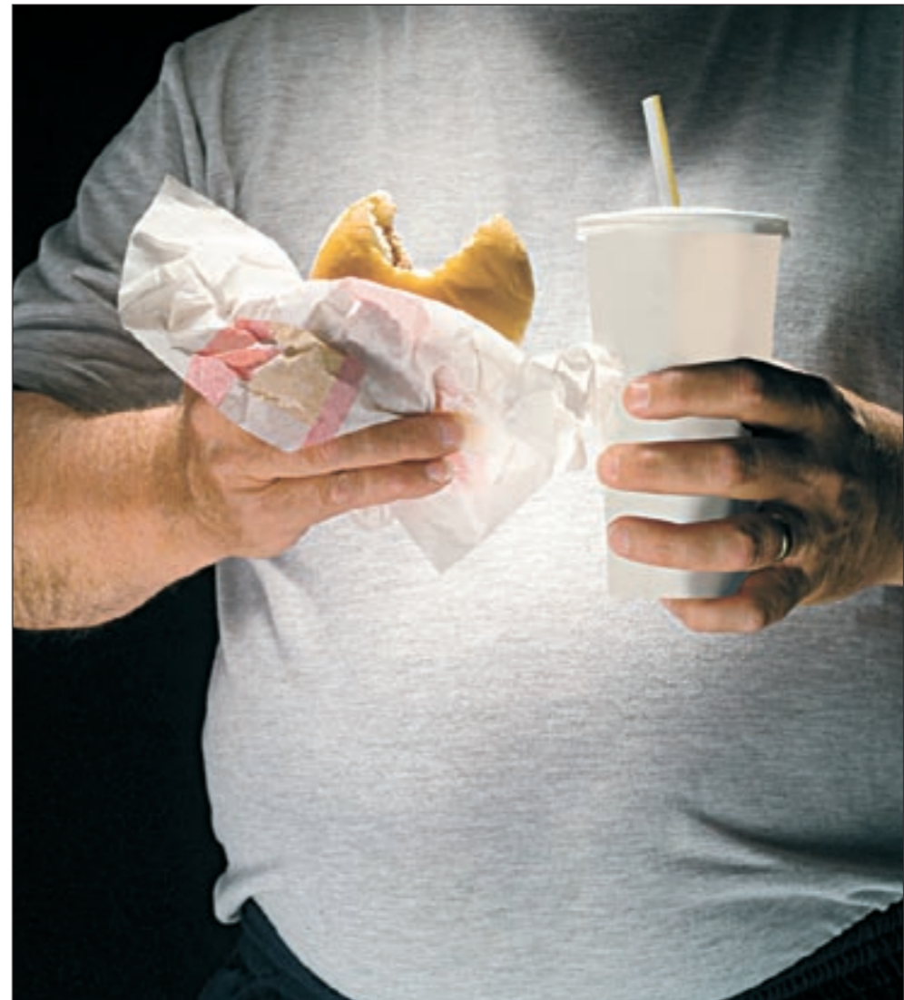
تناول السوائل أثناء الأكل يسبب ارتجاع المريء

هل ضعف الجهاز الهضمي أو عسر الهضم يسبب سرعة في دقات القلب؟