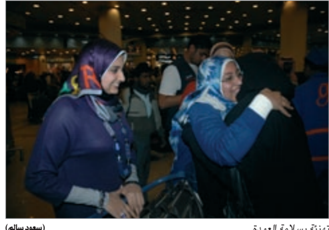
تهنئة بسلامة العودة