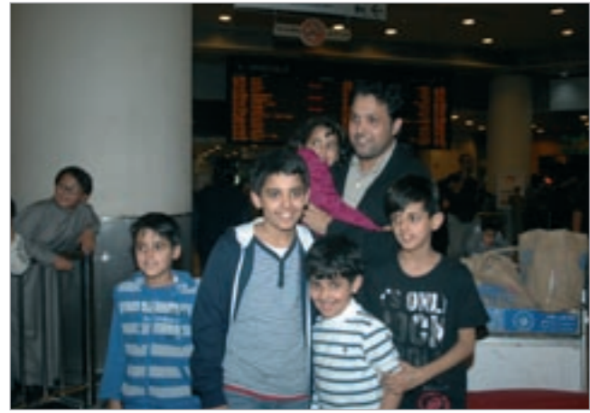
أحد الواصلين مع عائلته

بدمره، أعلن سفيرنا في القاهرة د. رشيد الحمد عن حالة من الطوارئ والاستعدادات في السفارة لتوفير جميع أنواع الرعاية للراغيبين الكويتيين والطلبة في مصر. مضيفاً انه سيتم توفير خطوط الطيران الجوية الكويتية بمعدل رحلة تغادر القاهرة 4 عسرا