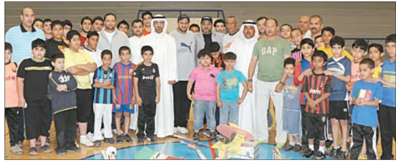
لقطة تنكارية في مركز شباب العدان

أقيمت بمركز شباب العدان التابع للهيئة العامة للشباب والرياضة دورة تدريبية في تعريف أعضاء مراكز الشباب بمكونات الطائرة اللاسلكية داخل الصالات المغلقة (صنعها و عملها) والأدوات المستخدمة في ذلك، بالإضافة إلى تأهيل عوامل الأمن والسلامة. وتم تقديم عرض عملي كيفية تشغيل نماذج من هذه الطائرة المتحركة بمراكز الشباب.