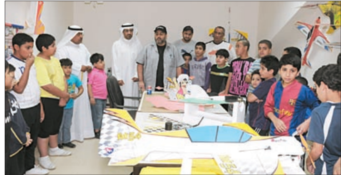
متابعة لأشكال وطرق تصنيع الطائرة اللاسلكية

أقيمت بمركز شباب العدان التابع للهيئة العامة للشباب والرياضة دورة تدريبية في تعريف أعضاء مراكز الشباب بمكونات الطائرة اللاسلكية داخل الصالات المغلقة (صنعها و عملها) والأدوات المستخدمة في ذلك، بالإضافة إلى تأهيل عوامل الأمن والسلامة. وتم تقديم عرض عملي كيفية تشغيل نماذج من هذه الطائرة المتحركة بمراكز الشباب.