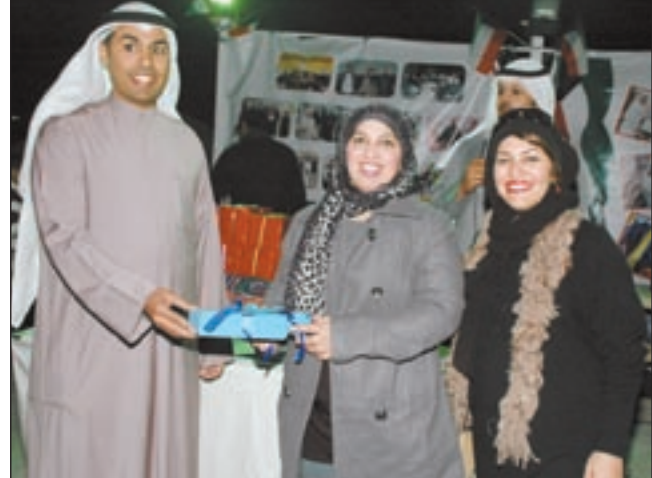
... وهدية لإحدى المتسابقات