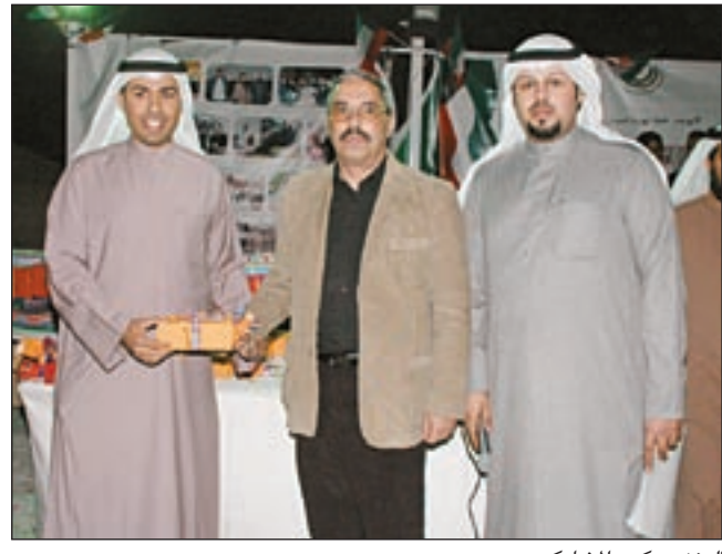
العنزي يكرم المشاركين