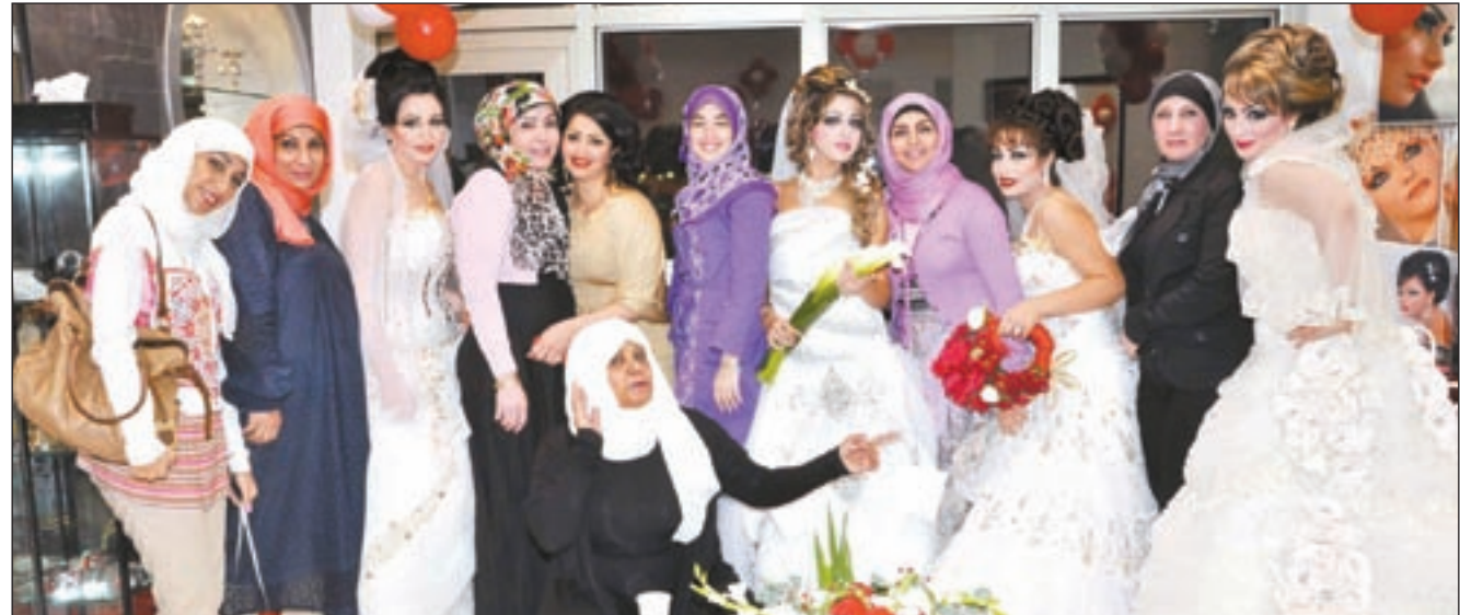
لقطة تنكارية في صالون رتاج