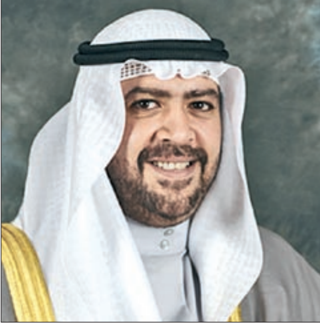
الشيخ أحمد الفهد

اشتكى عدد من المواطنات الكويتيات من عدم شمول قانون الرعاية السكنية للمرأة الذي أقر مؤخراً لكافة الحالات، وتساءل عدد منهن عن أسباب عدم السماح لزواج الكويتية الذي حصل على الجنسية الكويتية بالتجنس بعد زواجه من تسجيل طلب الرعاية السكنية من تاريخ الزواج أو طلب تقديم الزوجة وليس من تاريخ الحصول على الجنسية، وذلك أسوة بمن حصل على الجنسية بصفة أصلية من باب العدالة والمساواة. ومنا إلى وزير الإسكان الشيخ أحمد الفهد وكلنا ثقة بأنه لن يقبل بوجود تمييز بين أبناء الكويت في حقهم بالرعاية السكنية.