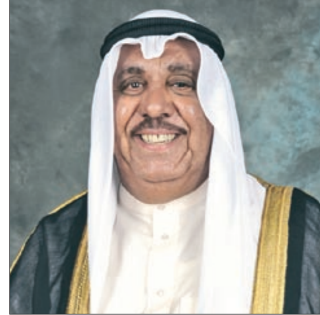
الشيخ جابر الخالد

وجه مقيم بريطاني مناشدة إلى وزير الداخلية الشيخ جابر الخالد يطالب فيها برفع منع دخول البلاد عنه وعن أولاده، حيث أنه كان من المقيمين بصورة غير قانونية (بدون) ثم قام بتعديل وضعه بعد حصوله على جواز سفر هولندي، لكن بعد انتهاء مدة الجواز وعند محاولته تجديده تبين أنه موزور، ثم غادر إلى بريطانيا وحصل هناك بعد خمس سنوات على الجنسية البريطانية، لكنه عندما قرر العودة إلى الكويت ففوجئ بوجود منع دخول للكويت عليه وعلى أولاده، ومنا إلى وزير الداخلية الشيخ جابر الخالد وكلنا ثقة بسرعة تجاوب الداخلية.