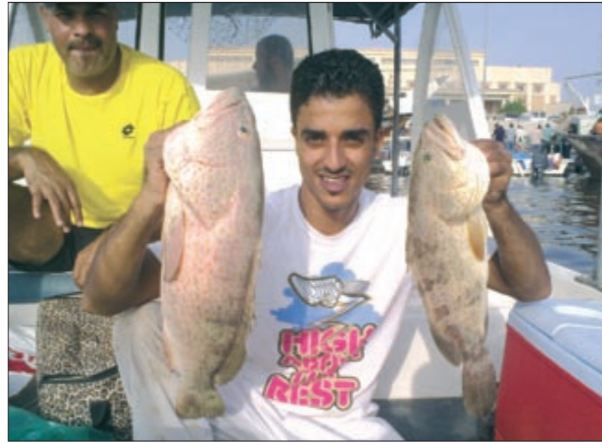
هذا الصيد يعطيك العافية «بوالليل»