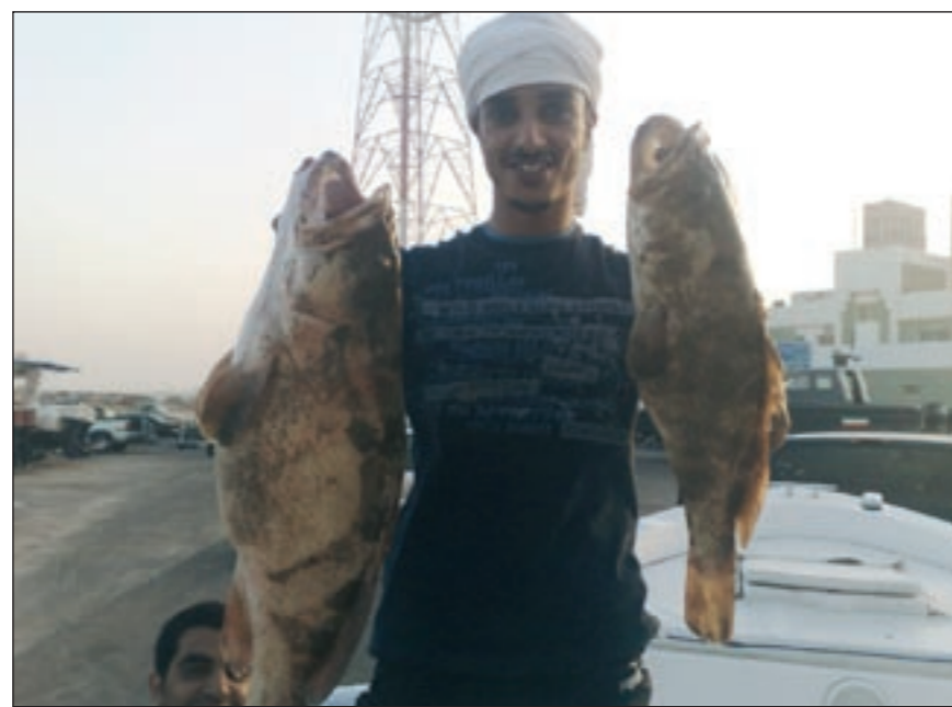
شوف الهامور والبالول يا سلام