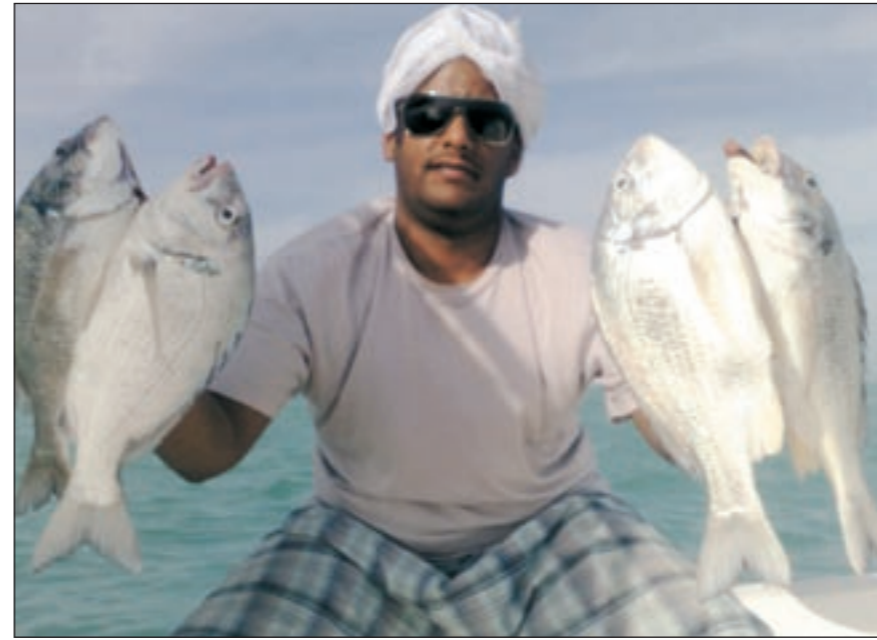
صيد المحادق الشمالية ممتاز