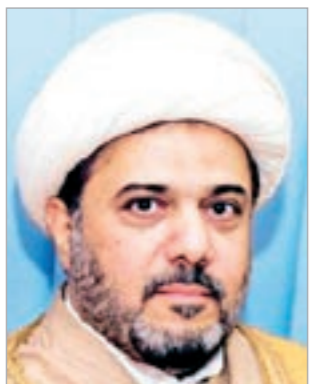
الشيخ راضي حبيب

وذلك بسبب تعاطفه الانساني في قضية اخلاء سبيل الايرانيين وعدم ابعادهم عن ذويهم في الكويت لعدم ثبوت الاتهام الموجه اليهم، ومن التناقض البرلماني ان يوجه الاستجواب لمثل هذا الرجل الاصلاحى نفسه وانه لا يحرص على حقوق مواطنيه الانسانية، فضلا عن المقيمين الذين يحرص على حقوقهم الانسانية. وختم الشيخ حبيب كلامه: ارجو من نواب الاستجواب ان يعوا هذا الامر ويفكروا مليا في عدم الاستعجال في تقديم الاستجواب الذي لا يزيد الشعب الكويتي الا رهقا، وان يعينوا الحكومة بماوافق الداعمة لا التآزيمية.