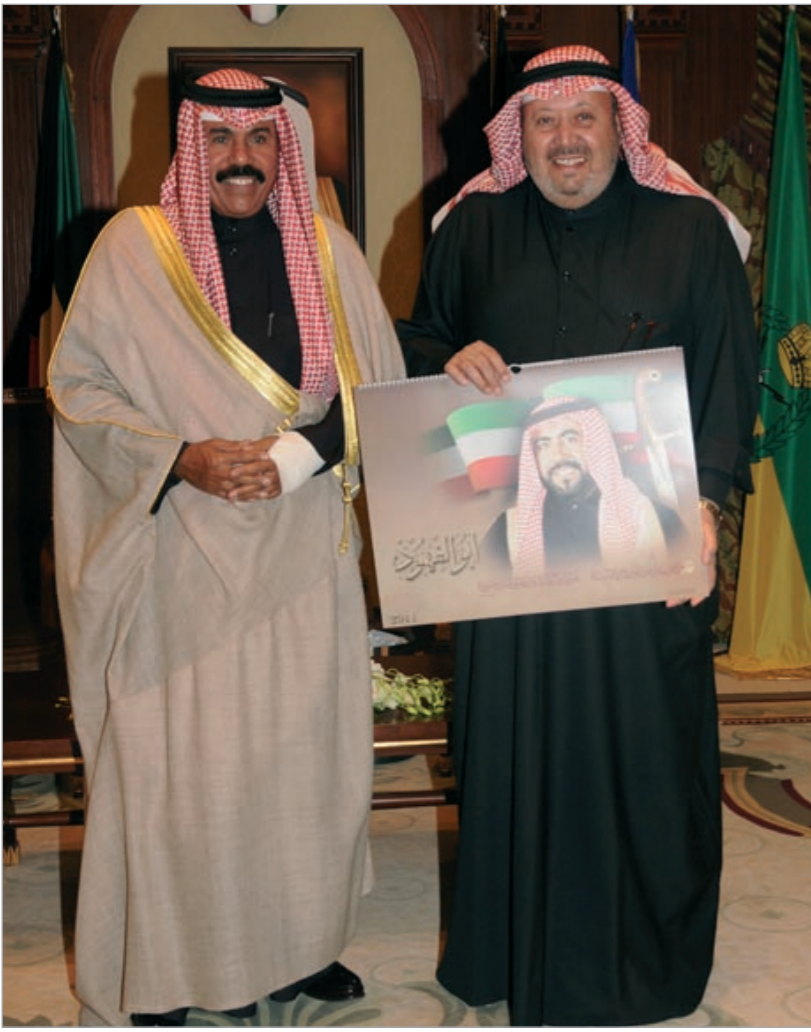
سمو نائب الأمير وولي العهد الشيخ نواف الأحمد يتسلم رزنامة الشهيد لعام 2011 من فيصل القناعي