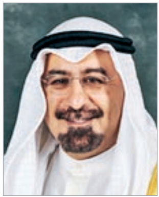
الشيخ د.محمد الصباح

تلقى نائب رئيس مجلس الوزراء وزير الخارجية الشيخ د.محمد الصباح رسالة خطية من وزيرة الخارجية الأميركية هيلاري كليتون حول العلاقات بين البلدين وبحث سبل تطويرها. إلى ذلك استقبل وكيل وزارة الخارجية خالد الجارالله سفير جمهورية صربيا ميهايلو براكيش الذي سلمه رسالة موجهة الى نائب رئيس مجلس الوزراء ووزير الخارجية الشيخ د.محمد الصباح من وزير خارجية صربيا فوك بريميتش.