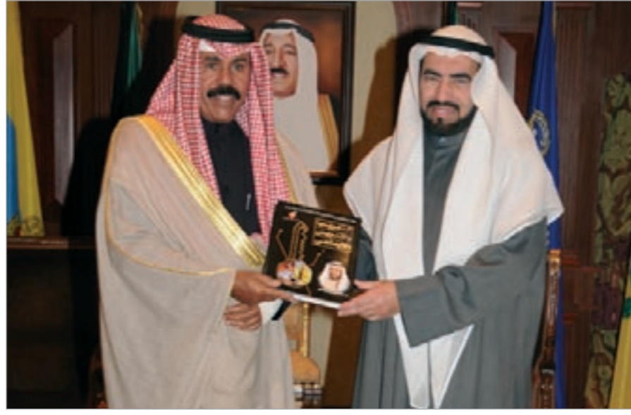
سمو نائب الأمير وولي العهد يتسلم موسوعة «الإدارة التاريخية الإسلامية» من طارق السويدان

استقبل سمو نائب الأمير وولي العهد الشيخ نواف الأحمد بقصر بيان أمس عضو مجلس الأمة النائب خلف دميثير. كما استقبل سموه أمين السر العام لجمعية الصحافيين الكويتية فيصل القناعي حيث اهدى سموه نسخة من رزنامة الشهيد السنوية لعام 2011، وقد شكره سموه متمنيا له التوفيق والنجاح.