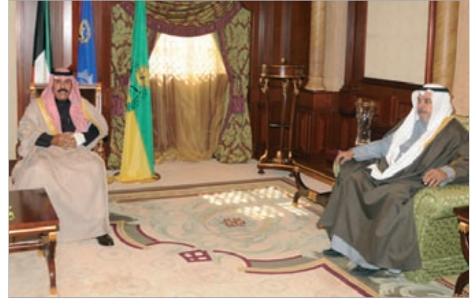
سمو نائب الأمير وولي العهد الشيخ نواف الأحمد خلال لقائه خلف دميثير

استقبل سمو نائب الأمير وولي العهد الشيخ نواف الأحمد بقصر بيان أمس عضو مجلس الأمة النائب خلف دميثير. كما استقبل سموه أمين السر العام لجمعية الصحافيين الكويتية فيصل القناعي حيث اهدى سموه نسخة من رزنامة الشهيد السنوية لعام 2011، وقد شكره سموه متمنيا له التوفيق والنجاح.