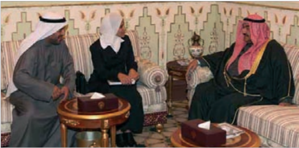
سمو رئيس الوزراء الشيخ ناصر المحمد مستقبلا داليا مجاهد وديبراهيم العنسانتي

استقبل سمو رئيس مجلس الوزراء الشيخ ناصر المحمد أمس مدير مركز الوعي لتطوير العلاقات العربية - الغربية د.ابراهيم العنسانتي ترافقه مستشارة الرئيس الأميركي باراك اوباما وكبيرة المحللين والمدير التنفيذي لمنظمة جلوب العالمية للرصد داليا مجاهد بمناسبة زيارتها للبلاد.