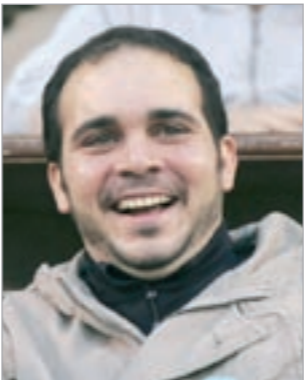
الأمير علي بن الحسين

عبر المعابر الإسرائيلية، والغيت مباراة كانت مقررة بين المنتخب المصري والمنتخب الفلسطيني في الضفة الغربية العام الماضي بعد ممارسة ضغط من قبل منظمات مناهضة للتطبيع مع الاحتلال الإسرائيلي في مصر. وكان رئيس اللجنة الاولمبية ورئيس اتحاد الكرة الفلسطيني جبريل الرجوب دعا في أكثر من مناسبة الأندية والمنتخبات العربية لزيارة فلسطين واعتماد الملاعب الفلسطينية لمعبيها في الاستحقاقات الإقليمية، معتبراً ان هذا الامر ليست له علاقة بتطبيع..»