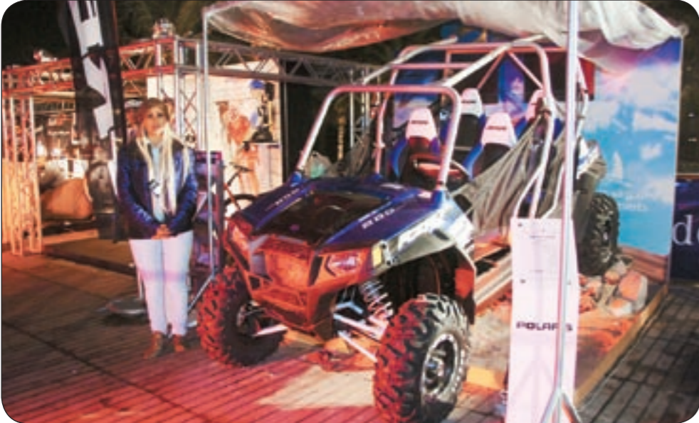
..وجانب آخر من السيارات المشاركة في المعرض