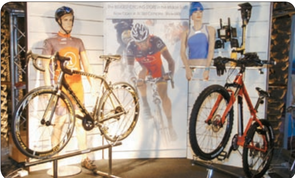
جناح خاص للدراجات الهوائية