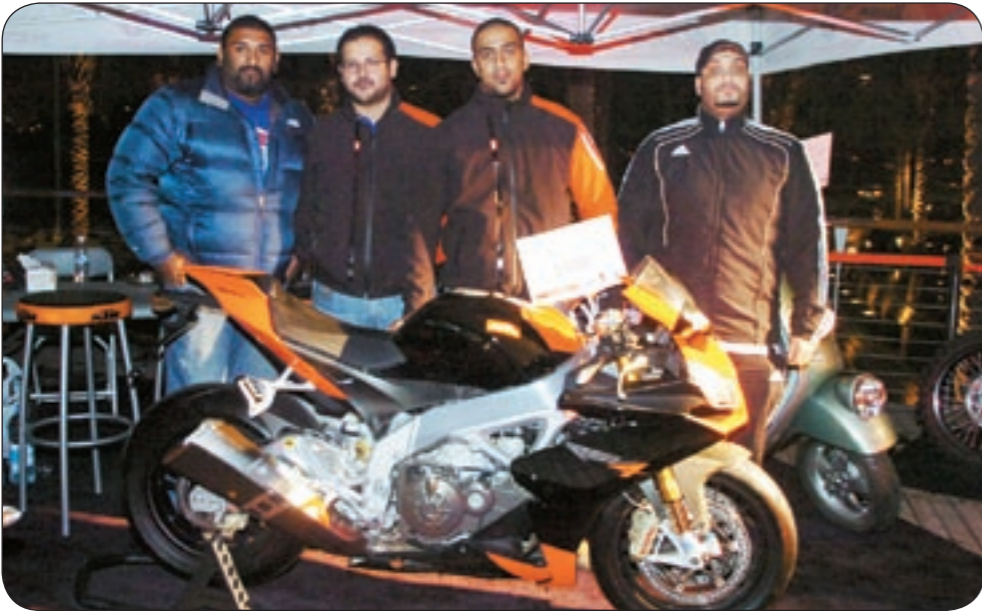
مشاركون في جناح خاص لعرض الدراجات النارية (تاسم بانها)