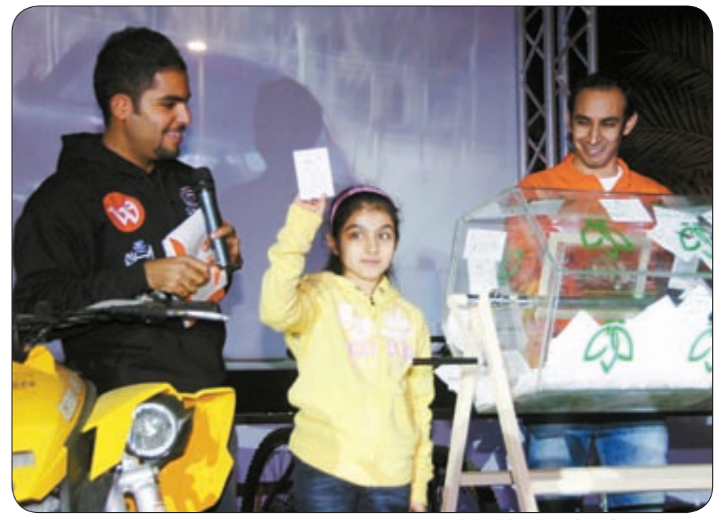
المضف خلال عملية فرز السحوبات وإعلان الفائزين

وفي ختام حديثه أوضح المضف أنه للسنة الرابعة على التوالي تقيم «GulfRun» معرضها لهذا العام مع شركة «بروفجين» المتخصصة في إدارة وخلق المشاريع والأحداث الرياضية حيث تستمد «بروفجين» أفكارها من خلال زملائها وشركائها من جميع أنحاء العالم، سيكون المعرض مغايراً عن العام الماضي من جميع النواحي وبطريقة احترافية مبتكرة تليق بسمة منظم GulfRun تجدر الإشارة إلى أن أنشطة GulfRun مازالت تلقي دعم ومساندة العديد من الشركات في مقدمتها الراعي الرئيسي وكل من Wataniya Telecom Consolidated Contractors من الراعي الرئيسي، Co. Abraaj Water, Jashanmal, Agility, Fasttelco وبالنسبة للرعاة الذهبيين فكان من نصيب Al-Sawan Travel & Tourism, Credit One, Slider Station