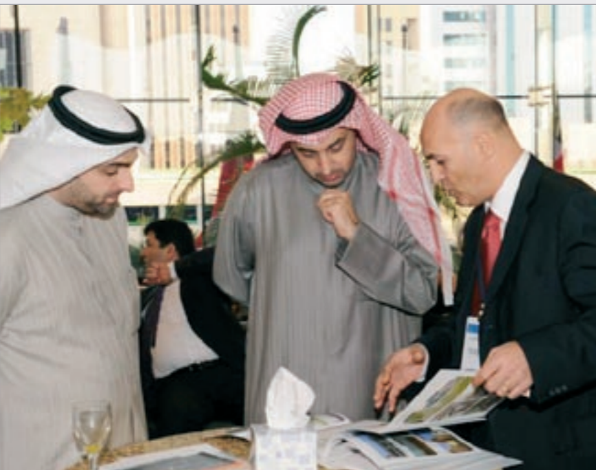
أحد أعضاء الوفد التركي في المقر الرئيسي للبنك الوطني

وأوضح أن تركيا تتطلع للتحويل إلى مركز مالي إقليمي على مستوى المنطقة وتأمل أن تترجم هذا التوجه على أرض الواقع في غضون عام.