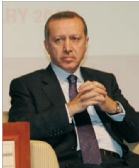
رجب طيب أردوغان متابعاً وقائع اللقاء