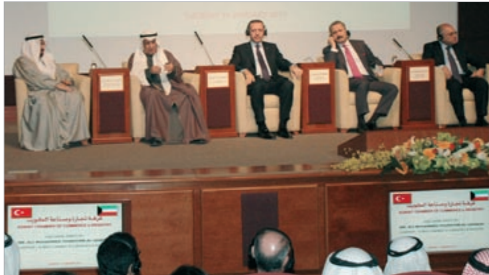
علي الغانم ورجب طيب أردوغان ويوسف المنصه ويبدو مستشار ديوان رئيس الوزراء إسماعيل الشطي (كريم نهاب)

تساهم بفاعلية في هذه المشاريع، وهذا الأمر سيؤثر إيجاباً ويخفف من تكاليف النقل. ولفت إلى أن الشركات التركية يمكنها المساهمة في مشاريع خطة التنمية بشكل مؤثر، مضيفاً أنه مع تخفيف تداعيات الأزمة المالية تمكن تركيا من استقطاب الاستثمارات الأجنبية المباشرة إليها والتي شهدت زيادة كبيرة خلال العام الماضي، داعياً المستثمرين الكويتيين إلى رفع استثماراتهم في تركيا في القطاعات المختلفة، وأوضح أردوغان أنه بعد مرور خمس سنوات أقوم بزيارتي للكويت البلد الشقيق العزيز، والتقيت بصديقي العزيز صاحب السمو الأمير، كما عقدنا اجتماعات أنا وزميلي سمو رئيس مجلس الوزراء الشيخ ناصر المحمد الذي أبدى الكثير من التعاون والفهم لأهمية تطوير العلاقات بين البلدين.