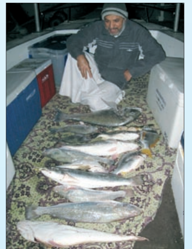
مجموعة صيد باحدى الرحلات