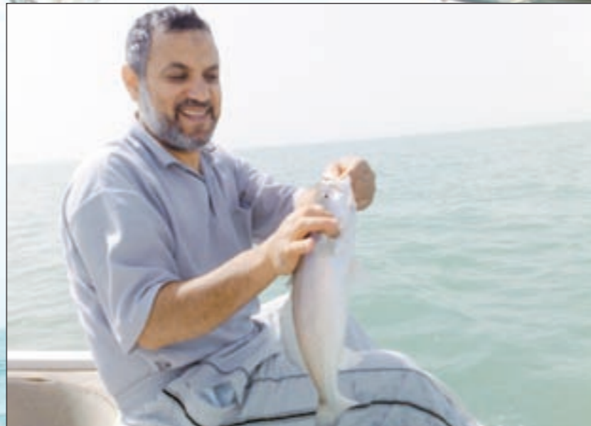
ماه كريم أول الفيث نوبي