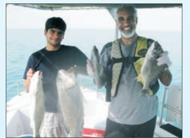
اشرايكم بالصيد العجيب