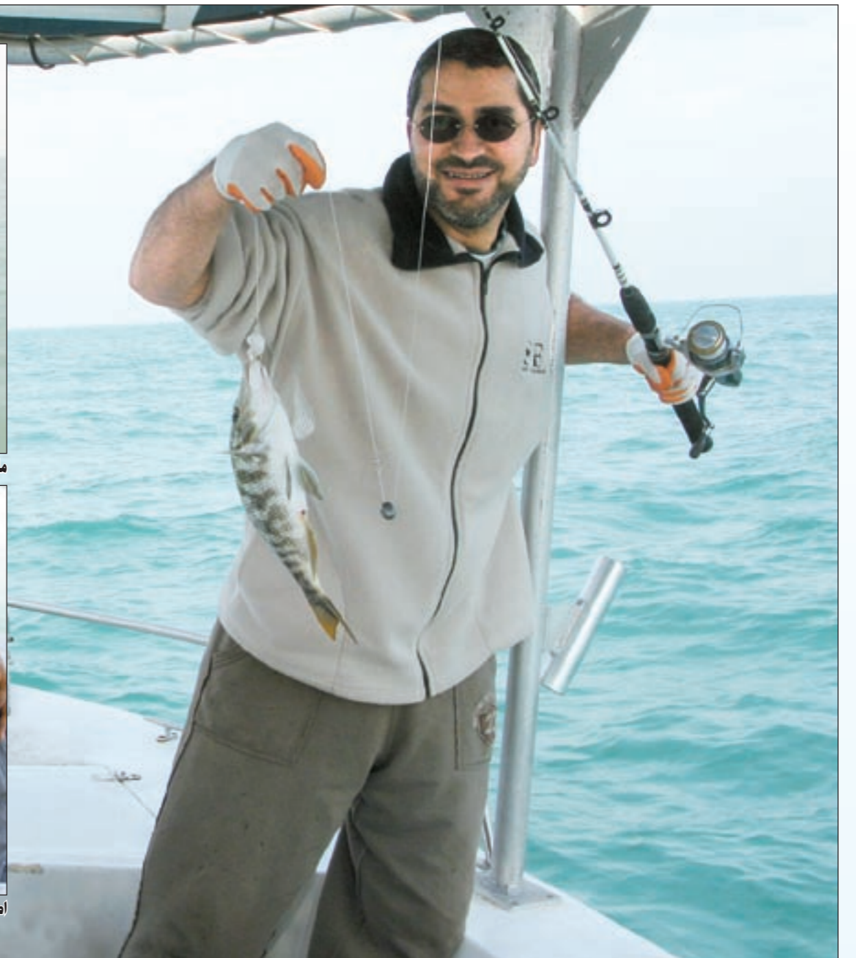
الشعري الفرش دائما الحلى