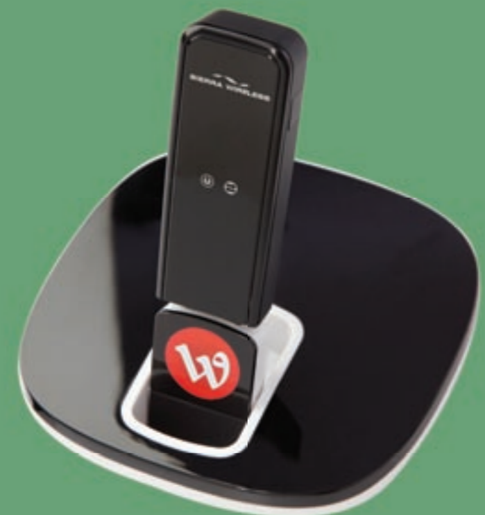
جهاز USB مع محوّل