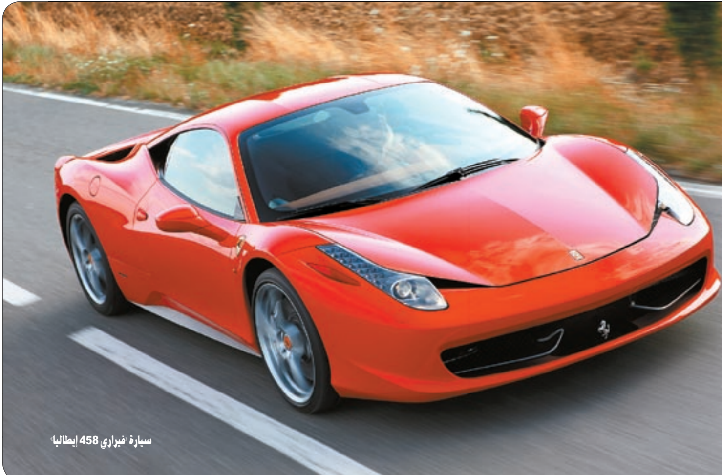
سيارة فيراري 458 إيطاليا

وتأتي جوائز «سيارة عام 2010» و«سوبر كار عام 2010» من مجلة «كار ميدل إيست» بعد سلسلة من الجوائز الأخرى التي فازت بها «فيراري 458 إيطاليا» مثل: جائزة «سيارة العام الأسرع» من «فيفت جير»، وجائزة «سوبر كار العام» و«سيارة العام» من مجلة «بي بي سي توب جير»، وجائزة «سوبر كار العام» من مجلة «جي كيو»، وجائزة «سيارة العام» من «ام اس ان كارز»، وجائزة «أفضل السيارات أداء للعام» من «أوتو إكسبرس». وقد تم الكشف عن «فيراري 458 إيطاليا» خلال معرض سيارات فرانكفورت في سبتمبر 2009 حين فازت باستحسان واسع، وبعد إجراء برنامج اختبار القيادة أمام الإعلام العالمي في «مارانيللو» التي تعتبر موطن علامة «الحصان الجامح» فقد حظيت السيارة بصدى إعلامي كبير، حيث كتب عنها أكبر الصحافيين في العالم وأبرزوا سهولة التعامل معها وقيادتها المرحة وأداءها الرائع.