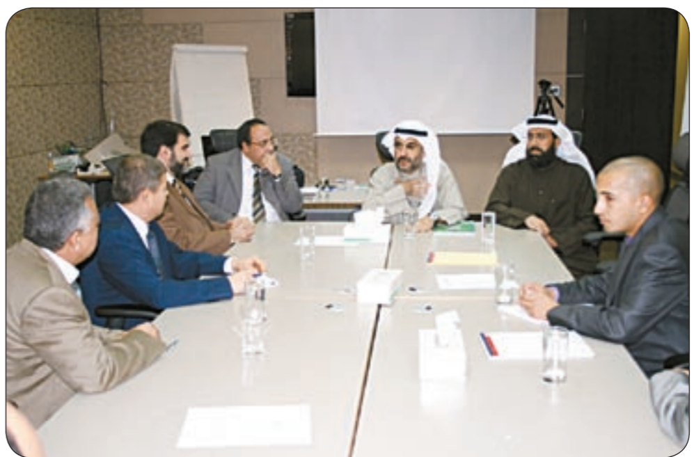
جانب من اجتماعات الوفد التونسي

كما ساهم في بناء مشروعات تنمية ضخمة في مجالات حيوية كالطاقة والمطارات وغيرها، كما تقوم المصارف التي يملكها في كل من تركيا والماليزيا والبحرين سواء من خلال نشاطها المصرفي أو من خلال المشروعات التي تملكها بدور الجسر التجاري الذي يربط المصالح التجارية بين الكويت ودول مجلس التعاون الخليجي مع تلك الدول والبلدان التي تحيط بها. من جهتهم، عبر أعضاء الوفد التونسي الزائر عن إعجابهم واعتزازهم بالنجاحات التي سجلها «بيتك» عبر مسيرته، مؤكداً على أن معظم الشعب التونسي يعرفون «بيتك» حق المعرفة ويعرفون مكانته المرموقة والكبيرة التي يحتلها بين المؤسسات المالية العالمية وأعرابوا عن رغبتهم في أن يمتد عطاء «بيتك» بحيث يشمل نقل الخبرة المتراكمة لديه إلى الجانب التونسي، خاصة أن هناك قسما خاصا للاقتصاد الإسلامي قد تم تأسيسه في جامعة الزيتونة وأن مساهمة «بيتك» في هذا الجانب سيكون محل تقدير الجميع.