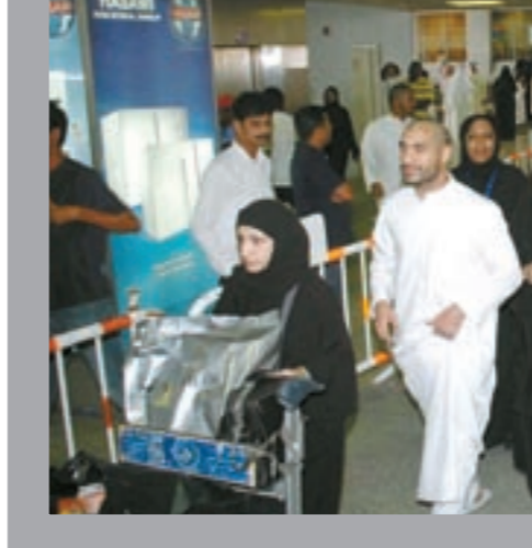
مطار الكويت شهد ازديادا غير طبيعي نتيجة لتأخر عودة رحلات الحج هذا العام

هناك حديث عن مخالقات عديدة لحملات الحج الكويتية هذا العام، كم عددها تقريبا وما نوع الجزاءات التي فرضتها السلطات؟