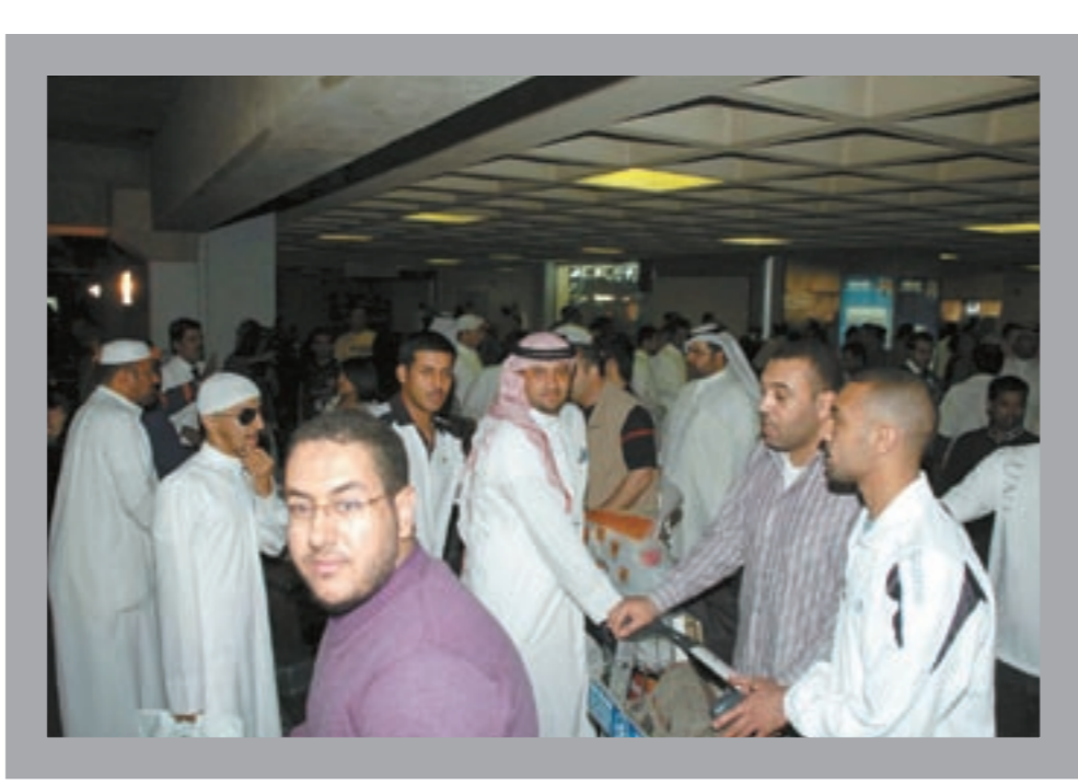
حجاج كويتيون عبروا عن استيائهم من طول الانتظار في مطار جدة

لاول مرة يتم احتجاز حجاج الرصيف هذا العام في منفذ الرقعي السعودي ليومين وأكثر وأيضاً انقلاب حافلة ركاب وموت عدد منهم، بم تنصرون من