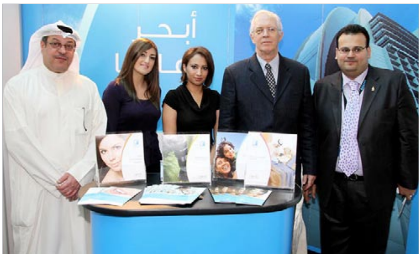
جناح السيف في معرض «GUST»