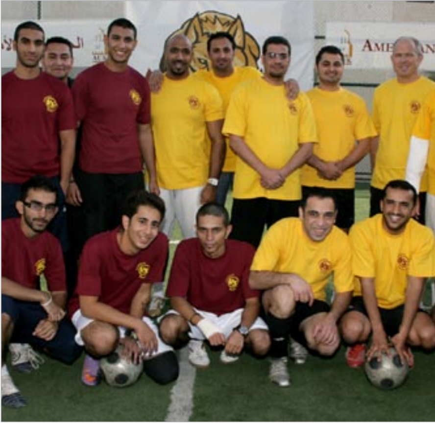
تفريق كرة القدم قبل المباراة