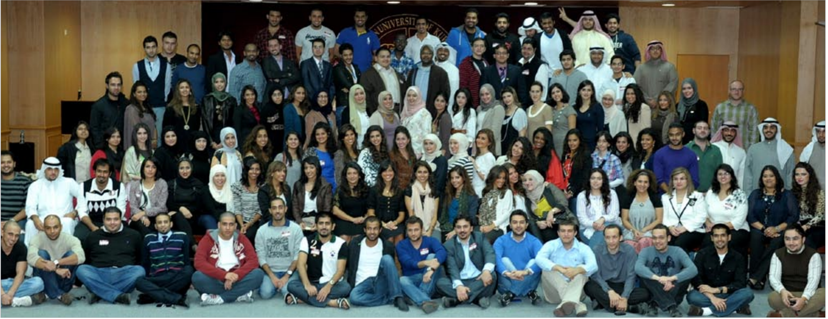
أعضاء هيئة التدريس في الجامعة الأميركية والطلبة المشاركون في أنشطة الأسبوع خلال صورة تذكارية