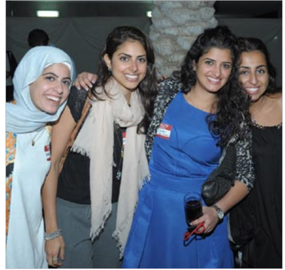
مجموعة من الطالبات المشاركات

بأنشطة مميزة ومشوقة استضاف قسم شؤون الطلاب بالجامعة الأميركية أسبوع أنشطة خاصة بالطلاب الجدد تحت عنوان «عشاء مع الرئيس» إضافة إلى لقاء في كرة القدم بين أعضاء هيئة التدريس والطلاب وصولاً لحفل الاستقبال السنوي للخريجين. بدأت أنشطة العودة بيوم التعبير عن الاعتزاز بالجامعة الأميركية في يوم 28 نوفمبر، حيث قام مكتب الحياة الطلابية بتسليم الجوائز المقدمة من قبل الجامعة الأميركية خلال حفلة شواء حيث ظهر موظفون من الذكور والإناث بالكلية في لقاءين لكرة القدم مع الطلاب وفاز الموظفون في كلتا المناسبتين، وبالإضافة إلى ذلك، كان هناك مسابقات لمهارات التحكم بالكرة وتسجيل الأهداف، وفي المساء شارك الطلاب في نشاط للغناء بمصاحبة الموسيقي «كاروكي»، وشهد اليوم الثاني (اليوم الكبير في الخارج) العديد من الأنشطة المختلفة شملت الرسم والكثير من الألعاب منها المنصة والتطريخ والعب الكرنفال، وشارك حوالي 206 طلاب في هذه الأنشطة وكانت هناك جوائز قيمة للفائزين وفي المساء استضاف مكتب العلاقات أولياء الأمور وشؤون الخريجين خلال لقاء «عشاء مع الرئيس» وهو حدث يعطي الطلاب الجدد وإبائهم فرصة للقاء والتحدث مع رئيس الجامعة الأميركية د.بنفريد توميسون، وحضر هذا الحدث أكثر من 40 من الطلاب