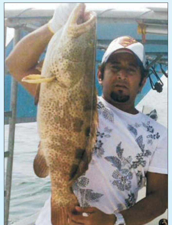
هذا الهامور ببيله عزيمة