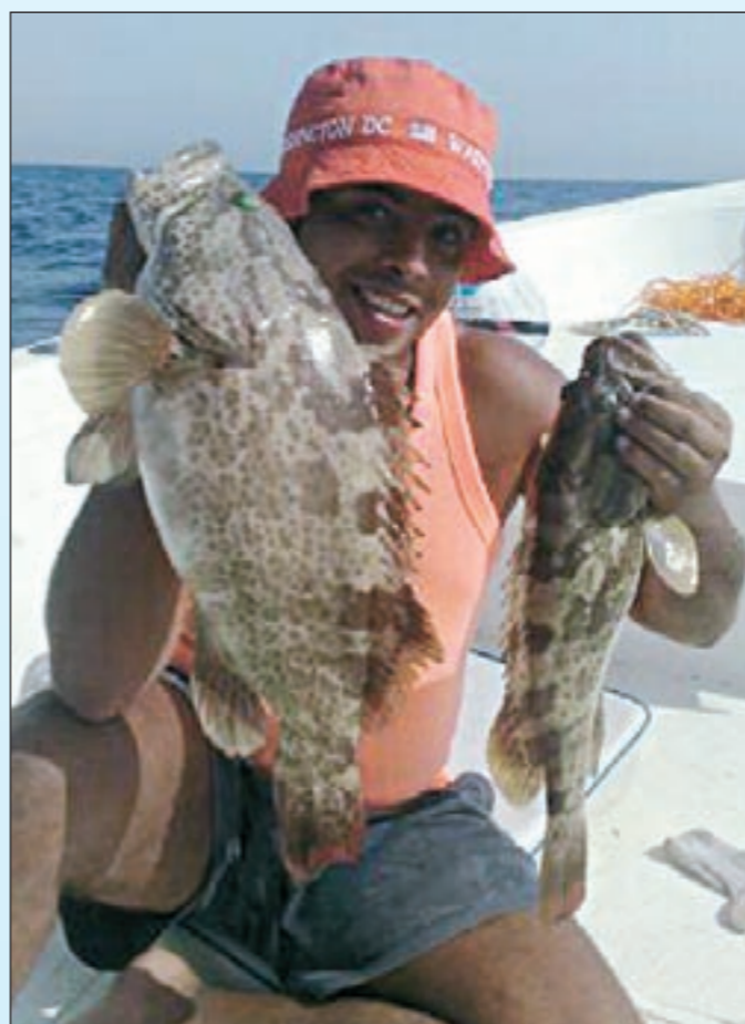
والله راهي على البواليل

ما نوع اليم الذي تستخدمه خلال رحلاتك البحرية؟