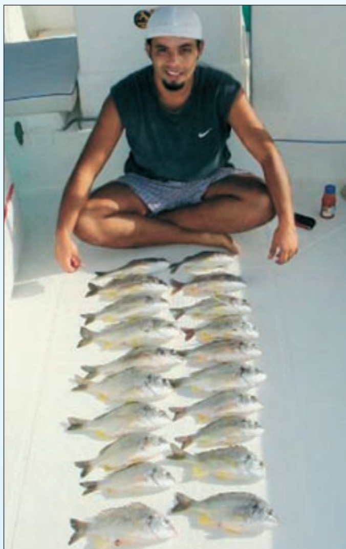
الزبن عندنا والشين حولينا