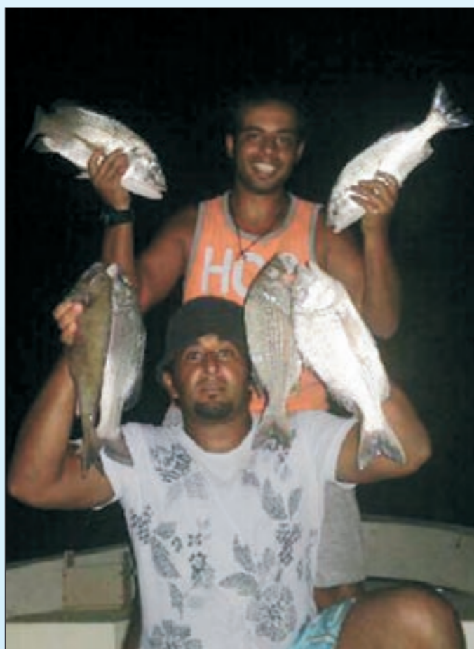
شوف الشعوم السنتة