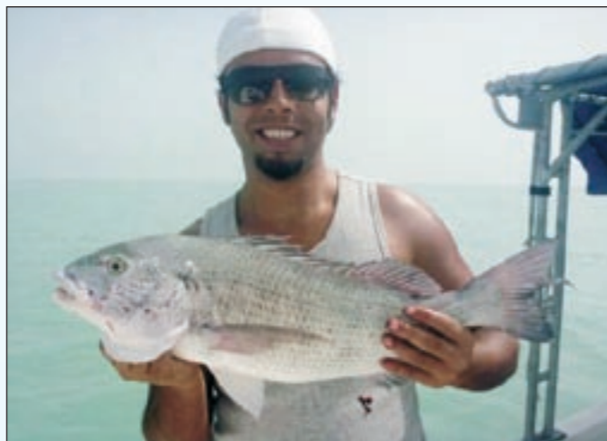
بصرحة فنان على المصيدة اسبيطي