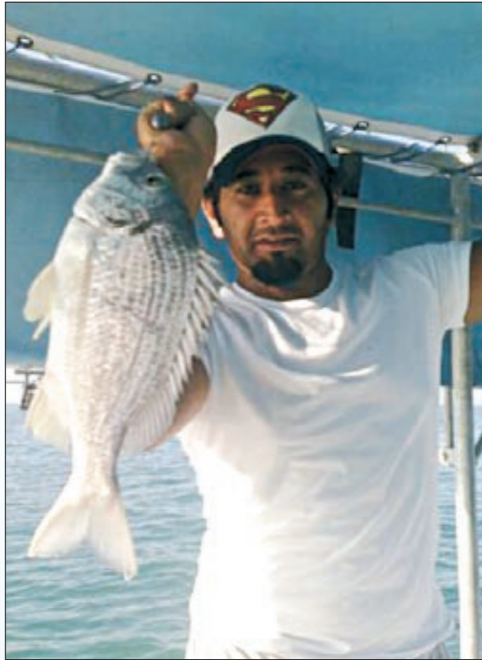
تسلم الأيادي على مصيدة