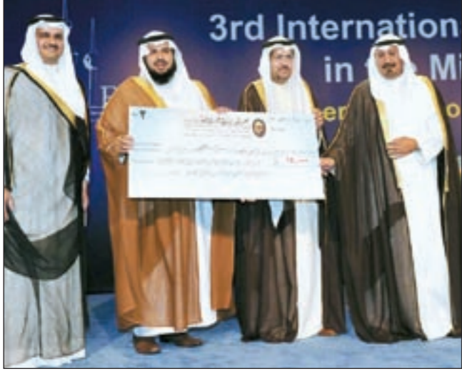
صاحب السمو الملكي الأمير نايف بن ممدوح متمسلاً بالجائزة (محمد ماهر)

الفرغوسية في الخارج، وأنه فارس ويحب الخيول كثيراً ولديه فريق من الشباب، لافتاً إلى أنه حصل على ميداليات ذهبية في سباقات الفروسية.