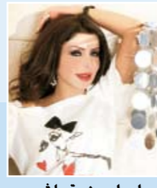
إعداد: منيرة عاشور

كوني دائما متجددة ومتألقة مع كل ما هو جديد لدينا في عالم الجمال والأزياء والأناقة. والآن من خلال الموقع الإلكتروني تابعي واختاري كل ما هو جديد في عالم الموضة والتجميل ولا تترددي في الاستفسار والتواصل معنا عن طريق البريد الإلكتروني smilesalon@hotmail.com أو الخط الساخن 99324425 كوني دائما مميزة وجذابة بإطلالتك معنا.