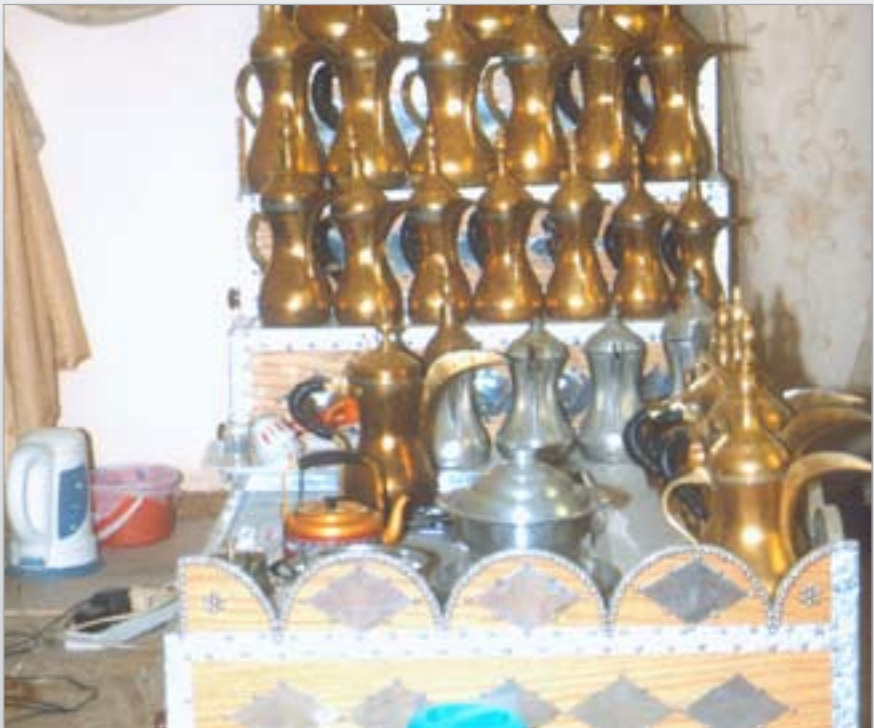
دلال القهوة يحتفظ بها الغريب في الديوانية

باسم الله الرحمن ابدأ كلمتي وابدا تعابيري على السطور واكتب احاسيسي على بيض الورق مشاعري والكلم له شعور الله يقدرني على وصف الذي أحس فيه بغاية السرور لأجل بلاد عشيت في خيراتها اصلي وكل للأصل ماسور أرض العروبة دينها دين الهدى فيما مضى وقيما تمر عصور بجاه من تسعى العباد لطاعته الله عالم خافي الصدر ترثه مبارك فخرها وتاريخها والصقر احفاده تجي صقور اورث لهم حكم البلاد وحقهم حسب الثقة ما بينهم والشور الى آخرها والقصيدة طويلة