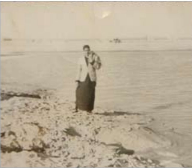
صورة للغريب وهو شاب صغير بين الصخور

يا عبيد صرنا حمير للسنافيه شالت علينا الحطب يا حامي التالي مع الأسف صرنا حمير على الطفه الشاوية من عقب شيل الحطب ما صرت رجالي هذه الأبيات مما كتبت وأنا في البر، فقال الرويلي: يا سعود يا ابن غريب وشلك بعيدة وشلك بغض النهدي يا قرم الأولادي عين الوحش لو نصبت الشج ما تصيد وأنا طالبك الزعل عن بنت الأجوادي بعد ذلك رجعت الى الكويت وبدأت أكتب القصيد وعام 1995 نايف المخير كان يجر صفحة الفن وكتت أرسل له. وناشي الحربي موجود في مجلة مرآة الأمة وياشرت النشر وهذه قصيدة غزلية أقول فيها: أنا ما مثل ما كنت بالاول أنا تغيرت واللى بيينا تحول أنا مو صرنا أهواج وتحمل غسورج والى الطريق اللي مشيتها فهمتك لكن انتي ما فهمتني عرفتك كاذبة وانتي جهلتيني تقولين لي احبك يا بعد عيني