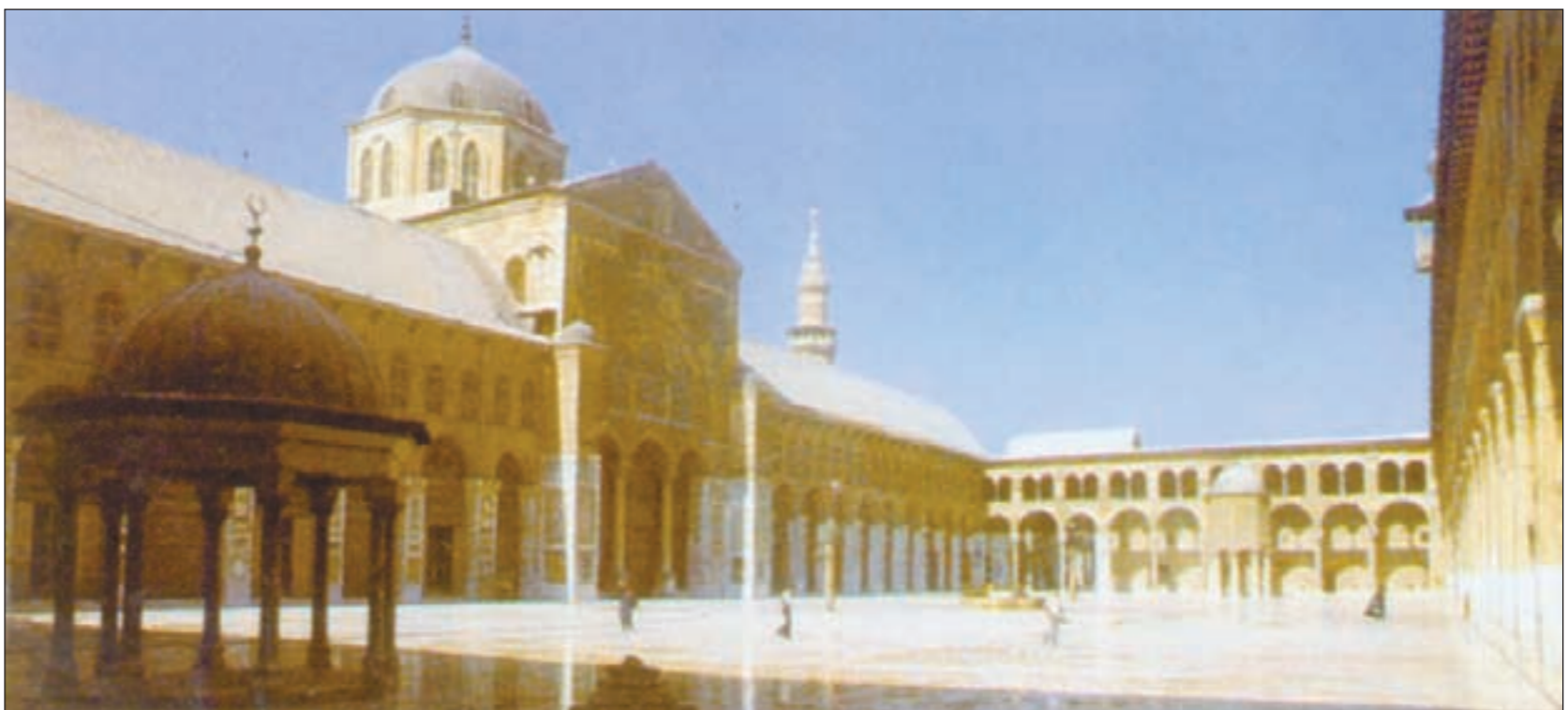
ساحة الجامع الأموي