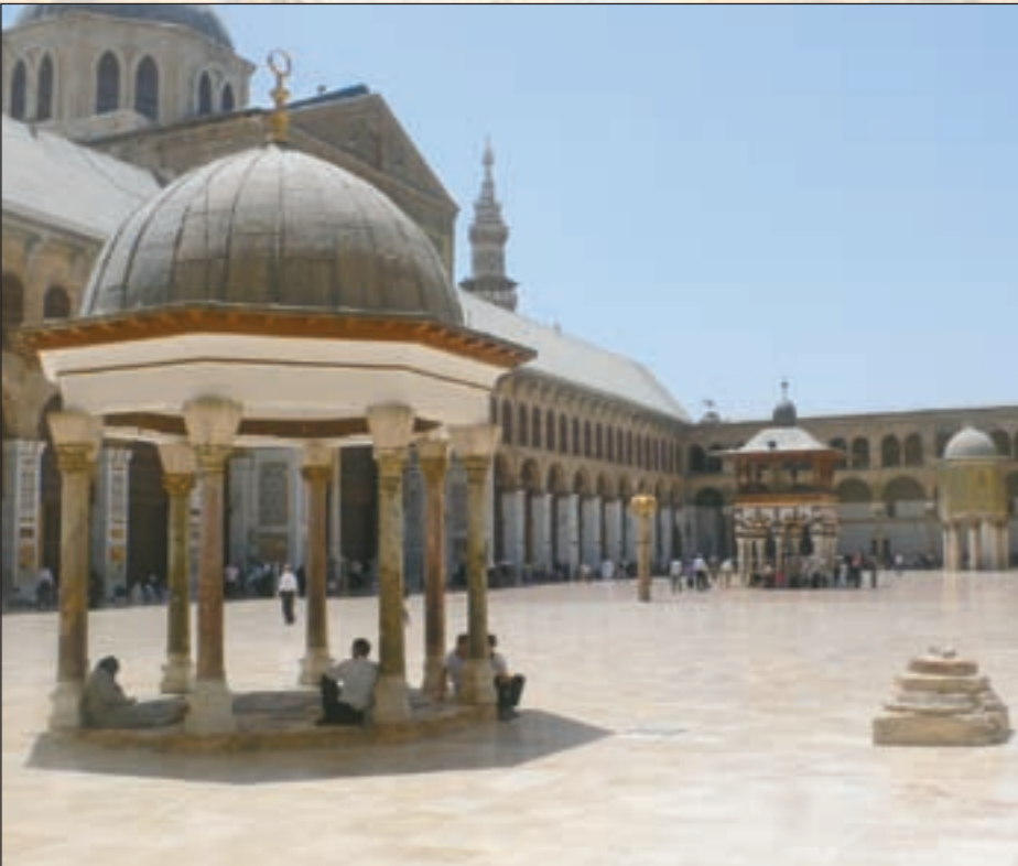
قبة العروس داخل المسجد الأموي

إن الجامع توجد فيه ثلاث مآذن أهمها مؤذنة العروس التي تتموضع شمالاً وتتوسط المؤذنتين وسميت بـ«العروس» لأن أهل دمشق كانوا يزيتونها بالفوانيس والشموع في الأعياد الدينية وتظهر كما العروس تتوسط المحتفين بها. أما المؤذنة الشرقية فهي لسيدتنا عيسى عليها السلام وأقدم مؤذنة في الإسلام والثالثة بنيت في عهد المماليك في العام 893 هجرية وتتوسط المسجد قبة النسرة وهي أعلى نقطة في حرم المسجد ويبلغ ارتفاعها 45 متراً.