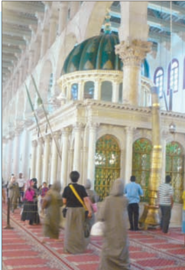
جانب من مقام النبي يحيى بن زكريا عليهما السلام

قال نائب المشرف العام بالجامع الأموي إن الجامع يدخله يومياً نحو 10 آلاف مصل وزائر من العرب والمسلمين الأجانب. وأضاف أن الجامع تعرض لحريق وزلزال في العام 1893 في عهد السلطان عبدالحميد الثاني وتم ترميمه وكان آخر ترميم أدخل على الجامع في العام 1991 في عهد الرئيس الراحل حافظ الأسد بـ400 مليون ليرة سورية، مشيراً إلى أن التجديدات حافظت على نفس الطراز برخامه المجزع والفسيفساء والرسومات التي تعلو باحة بابه الرئيسي ترمز إلى جنان وقصور وأشجار وأنهار.