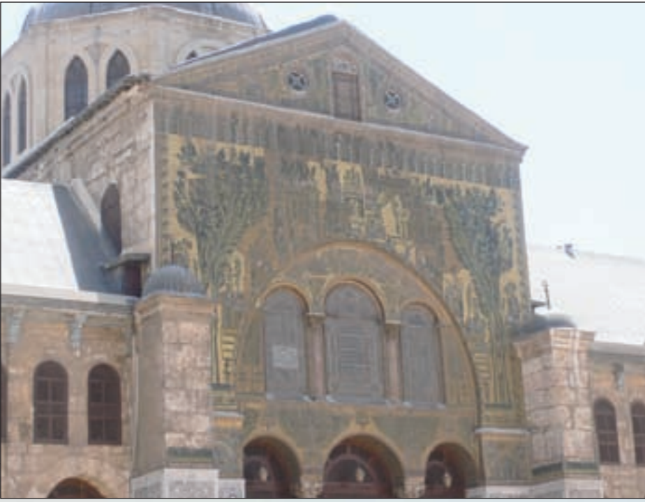
إحدى بوابات الجامع الأموي

أرض عبادة اختزلت طقوس الزائرين وديانات الفاتحين