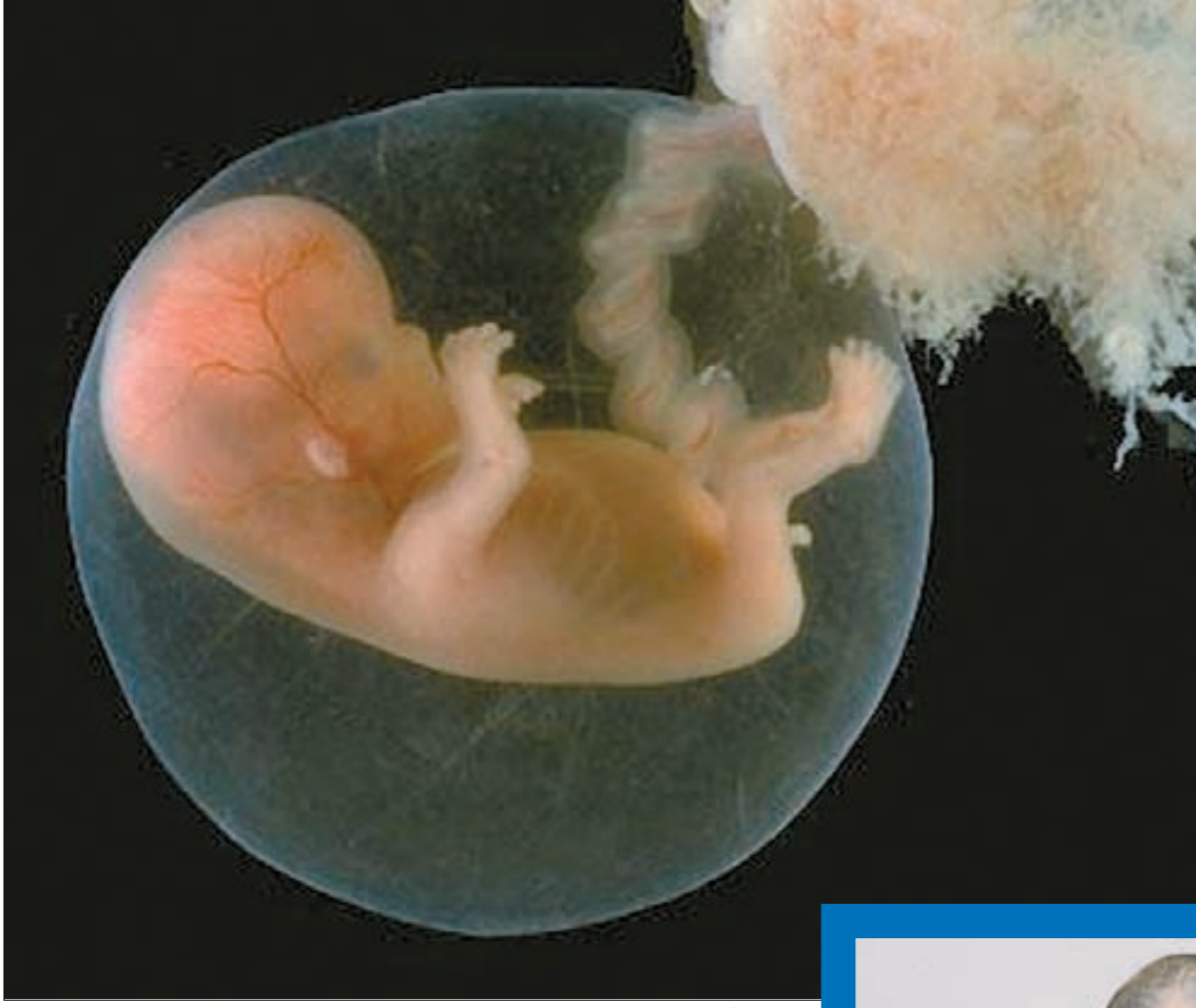
جنين في اوائل مراحل حياته

في هذه الحالة تقومين بعمل سونار على الرحم والمبايض، وليس اشعة فاذا كانا طبيعيين فراقبي الوزن فربما هو السبب وربما ظروف نفسية تؤثر على الدورة او ضغوط امتحانات او ضغوط عمل ايضا تؤثر على الدورة الشهرية، ولكن اذا كانت الهرمونات طبيعية والمبايض طبيعية والغدة النخامية طبيعية فعليك باخذ ادوية بسيطة تنظم الدورة لديك.