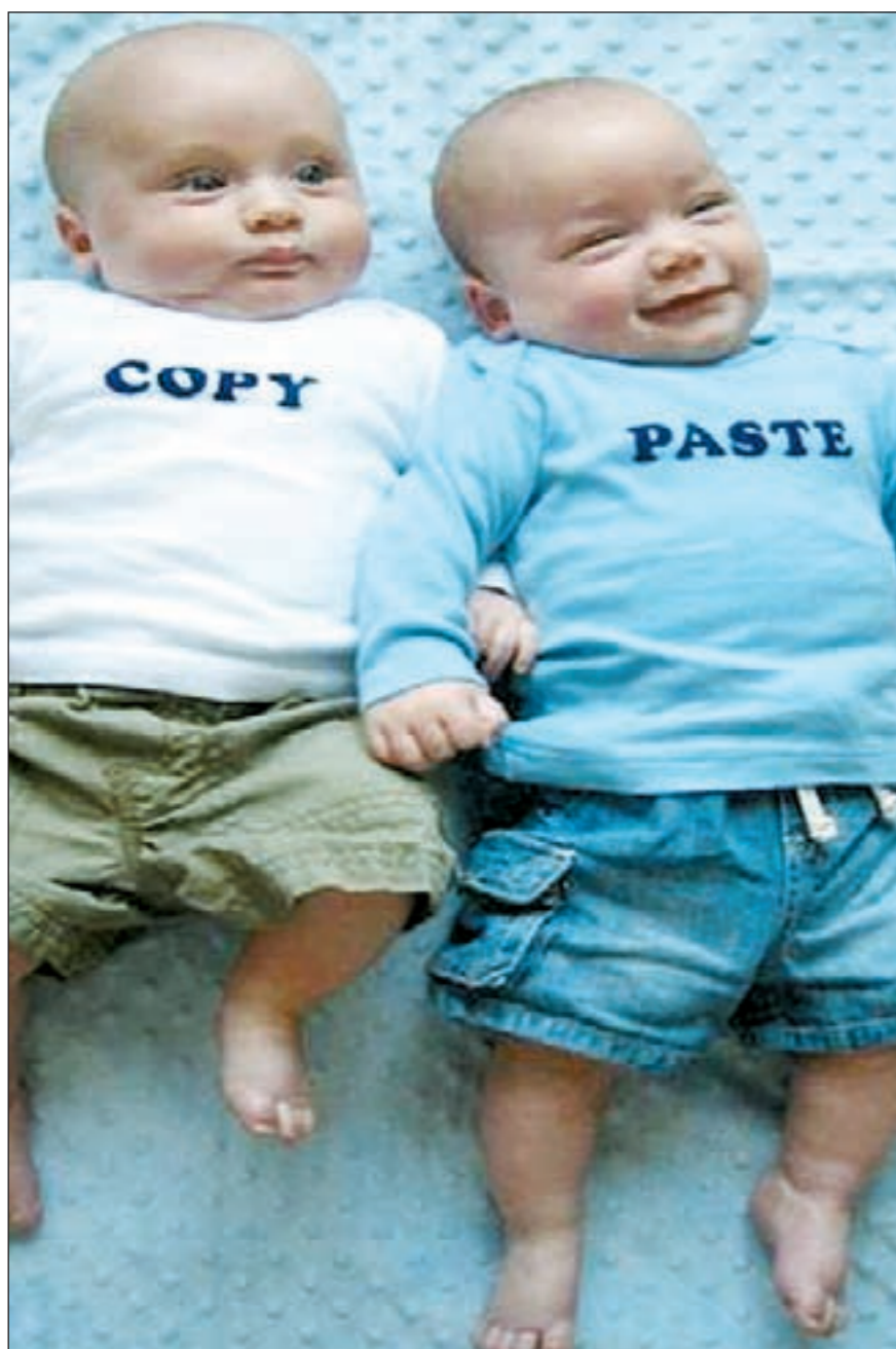
التوائم من الحالات المصاحبة للحمل في حالة تكيس المبايض

وخلال ردهه على القراء المتصلين أوضح د. الشاذلي الكثير من القضايا التي تهم النساء، مشيراً إلى التطور الكبير في مجال طب النساء والولادة وناصح كل سيدة تعاني من بطانة رحم هاجرة أو من «أكياس» كبيرة الحجم بان تلجأ إلى علاجها بتقنية المنظار قبل اللجوء إلى الجراحة التقليدية أما اللواتي يعانين من