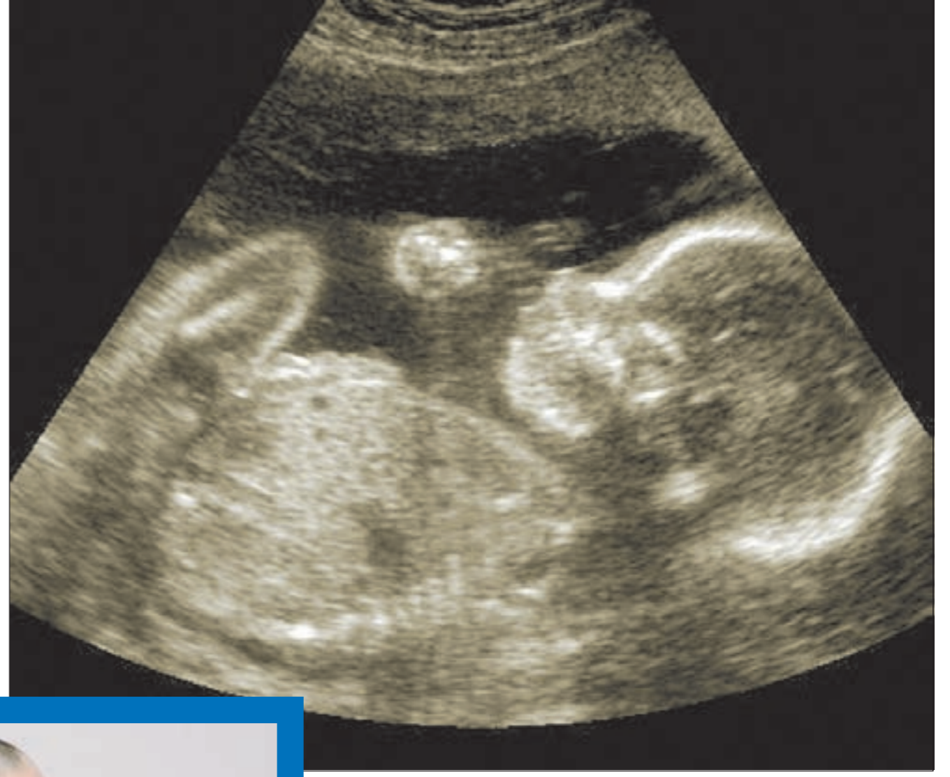
تشخيص العيوب الخلقية في مراحل مبكرة من الحمل بواسطة سونار

◀ إذا انقطعت الدورة الشهرية لسنوات ثم نزل دم من السيدة فعليها استشارة طبيبها