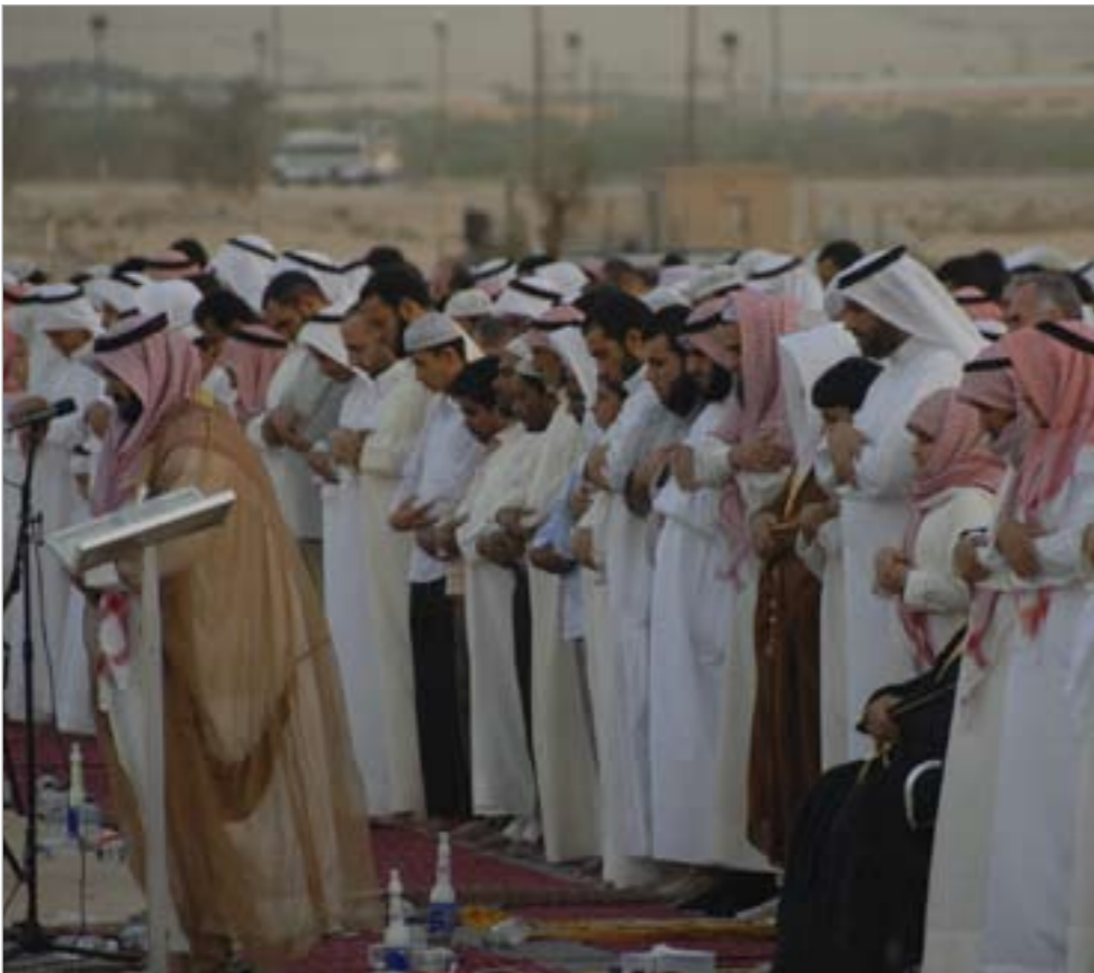
صلاة العيد في إحدى ساحات الجبراء