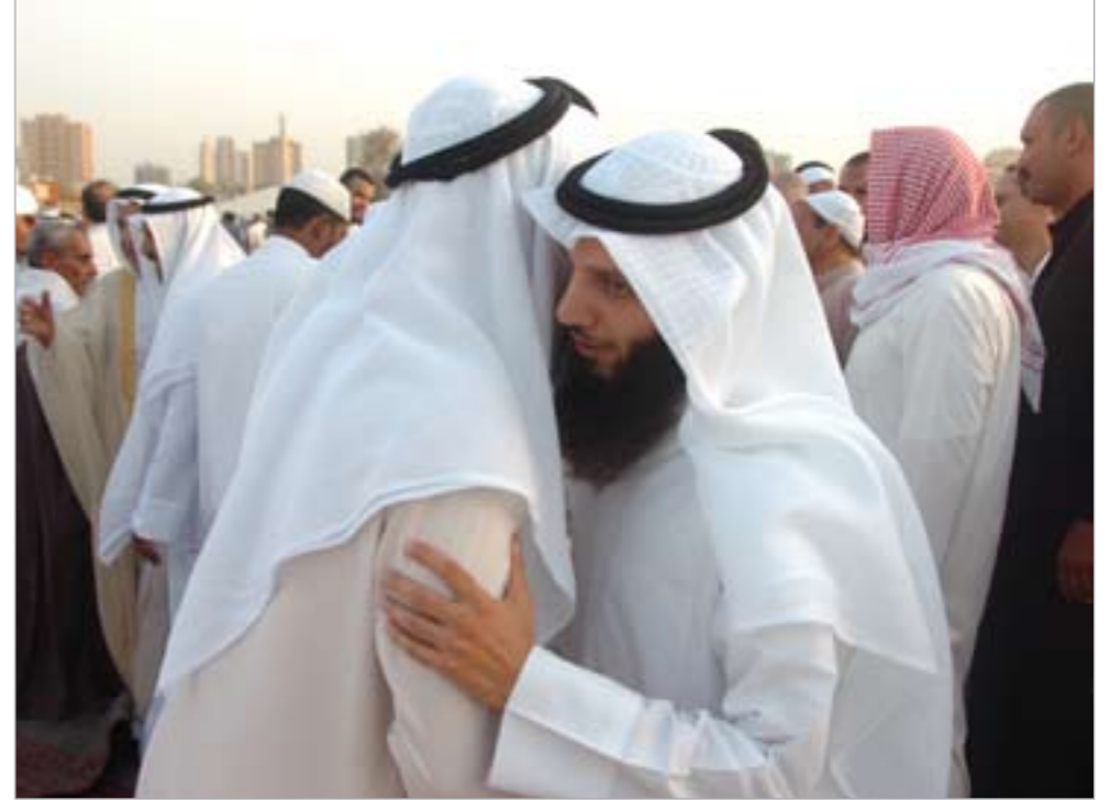
تقبل الله طاعتكم