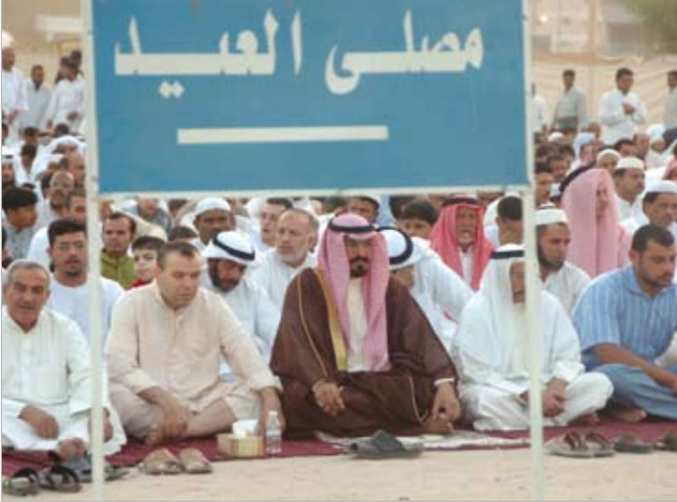
تكبير قبل إقامة الصلاة