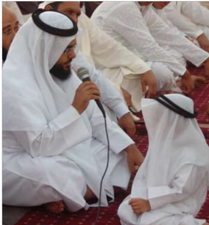
الله اكبر الله اكبر الله اكبر.. الله واكبر وله الحمد