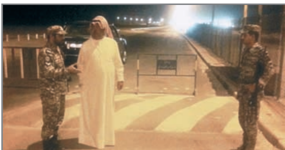
وزير الداخلية الشيخ جابر الخالد خلال تفقده أحد المراكز الحدودية

الهيئة الخيرية اعتمدت المرحلة الأولى من المشاريع الحيوية لمساعدة متضرري فيضانات باكستان ص3