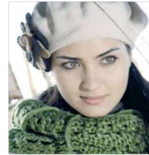
لميس (توبا بويوكوستن)

إم بي سي: تورطت الممثلة التركية توبا بويوكوستن، التي قامت بدور لميس في مسلسل سنوات الضياع، في دعوة لإفطار رمضاني جماعي لمعجبيها على الفيس بوك وتويتر، بعد أن انتحل مجهولون شخصيتها ونشروا الدعوة. «بوجون» التركية - معجبيها بعدم الاستجابة لدعوة الإفطار التي نفت توجيهها من الأساس، وقالت: «لم أنشئ أي حساب في الفيس بوك أو تويتر، فأنا لست عضوة بهذه المواقع، وليس لي أية علاقة بهما، ولكن هناك أشخاصا استخدموا اسمي وصورتي وتحدثوا مع معجبي بعد أن وضعوا أنفسهم في مكاني». وتابعت «أقولها بكل وضوح ودقة مرة أخرى، باني لم أشارك في هذه المواقع، وهناك أناس يستخدمون اسمي عبر الفيس بوك والتويتر، ويرسلون دعوات الإفطار باسمي ويشعرون بالسعادة، وأتمنى أنهم لم يسبقوا لي بأشياء أخرى». وتساءلت توبا: «ولكن ماذا أفعل»، وأجابت «أقصى شيء ممكن أن عمله هو عن طريق مستشاراتي الإعلامية أريم تومر بأن تكذب هذه الأخبار، وترسل تكديبا هنا وهناك لكي تخبر الناس بأن هذه الدعوات كلها أكاذيب في أكاذيب». وأعربت توبا عن أسفها لما حدث، ودعت إلى «محاربة هؤلاء الدجالين الذين يستخدمون اسمها ليضحكوا على الناس باكاذيبهم». كما حذر الكاتب الصحافي التركي إيكوت أشكلار من الاستجابة لتلك الدعوة، وانتقد منتحلي شخصية توبا على الموقعين الشهيرين، وقال في مقاله بالصحيفة: «تخيلا كم معجبا أو معجبة رأى هذه الدعوة»، وتابع في مقاله الذي حمل عنوان الأسبوع الماضي «لا تذهب إلى دعوة الإفطار إذا دعيت من قبل توبا بويوكوستن».