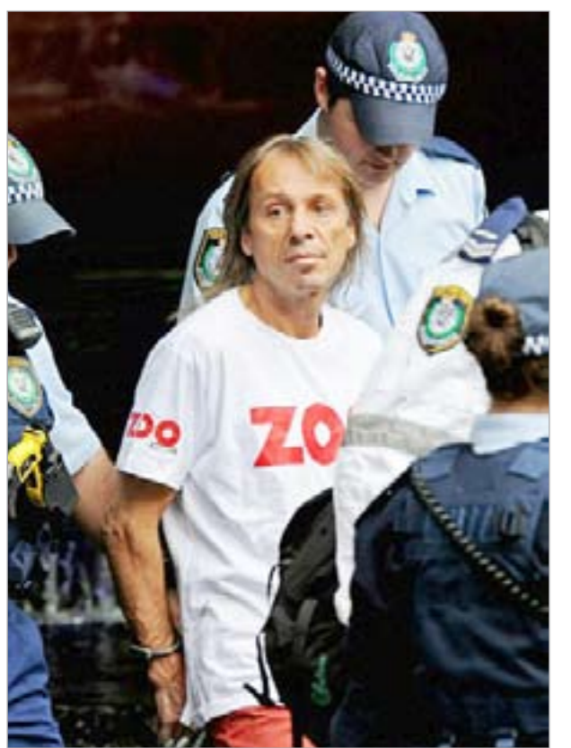
آلان روبري الملقب بالرجل العنكبوت في قبضة الشرطة الأسترالية

برلين - د.ب.أ: ليس كل ما يلعب ذهبا، مقولة يعلم كل من ظهر عليه طغح جلدي بعد استخدام مجوهرات رخيصة أو مقلدة مدى حقيقتها، والأّن أثبت العلماء الألمان أن مسالة الحساسية للمجوهرات المقلدة ليست خرافة. لا أحد يمتلك ذهبا خالصا، إلا إذا تصادف في 25 عنق آمون، إن كل ما نراه أمامنا اليوم من مجوهرات ذهبية ما هي إلا سبائك من الذهب المخلوط بمعادن غير نفيسة تكون بمنزلة عناصر أساسية مثل النحاس والنيكل. و«القيراط»، يحدد نسبة الذهب في تلك السبيكة، وكلما زاد القيراط كلما زادت نسبة الذهب وقلت نسبة المعدن الاساسي في قطعة المجوهرات، وكلما ارتفع السعر أيضا. قديمًا، كنا نفترض أن الكميات الضئيلة من المعادن غير النفيسة التي يتم مزجها بالذهب لا يمكن أن تؤدي للإصابة بحساسية الجلد. لكن الفئات الجديدة للباحث أثبتت إمكانية وجود حساسية لدى الشخص تجاه المجوهرات الرخيصة. إن ارتداء قرط مصنوع من السبائك المعدنية قد يصيب المرء بانتفاخ أو بثرة حمراء مؤلمة. العملات المعدنية وإبرميج حزام الخصر بل وحتى الهواتف الخلوية قد يكون لها نفس التأثير عندما تحتك بالجلد. والسبب أنها جميعا تحتوي على النيكل، وهو السبب الأكثر شيوعا لهياج حساسية الجلد بانواعها في العالم الصناعي. غير أن عددا محدودا من الناس يعلم أن النيكل يستخدم على نطاق واسع في صناعة المجوهرات «الذهبية».