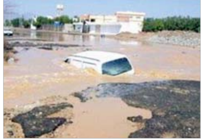
جانب من سيول محافظة الحديدة في اليمن

وأوضح مركز الإعلام الأمني لوزارة الداخلية اليمنية أن الأمطار والسيول تسببت في عزل ومحاصرة المنازل الواقعة في الجهة الشمالية الغربية بمديرية «الخوخة» بمحافظة «الحديدة» نتيجة وقوعها وسط الوادي الذي تدفقت عليه السيول. وقال إن الأمطار المصحوبة بالرياح جرفت عددا من قوارب الصيد التي كانت راسية على الشاطئ، كما جرفت أنابيب الصرف الصحي وغمرت محطة لتزويد السيارات بالوقود في المنطقة.