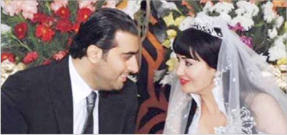
مشهد من مسلسل زهرة وأزواجها الخمسة

عن تغيبها. وكشف مازن حايك المتحدث باسم الشبكة لـ «د.ب.أ» على هامش الحفل عن مشروعات جديدة يتم الإعلان عنها في وقت لاحق إبرزها يجري التحضير له في العاصمة الأردنية عمان، حيث تقرر نقل جزء من النشاط الإنتاجي إلى الأردن.