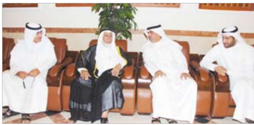
المستشار راشد الحماد في حديث مع الخبراء والاعتبار مضيفاً «وإذا أقر الكادر فسيفتح العديد من الامتيازات للخبراء وهم يستحقون هذه الامتيازات نظراً لطبيعة عملهم».

عمل مستمر سواء عن طريق الدورات الداخلية التي تقيمها الوزارة عن طريق إدارة التطوير أو الدورات التي يقيمها معهد الدراسات القضائية والقانونية بالإضافة لدورات خارجية تقام خارج البلاد سواء للمهندسين أو المحاسبين، فعندما توجه لنا دعوة من الدول التي تقام فيها مؤتمرات أو دورات متخصصة فنحن لا نتردد في إيفاد مجموعة من الخبراء للاستفادة من هذه المؤتمرات والدورات». وعن التعيينات بقطاع الخبراء أكد الدارمي انه «في كل عام تقريبا نقوم بإجراء تعيينات على حسب القضايا الواردة الينا من المحاكم والنيابة العامة، وإذا نظرنا للاحصائيات السنوية الخاصة بتلك القضايا فسنجدها في تزايد مستمر، وبالتالي فإن هذا يستلزم وجود تعيينات جديدة، وإن شاء الله خلال الأسابيع القليلة القادمة ستكون