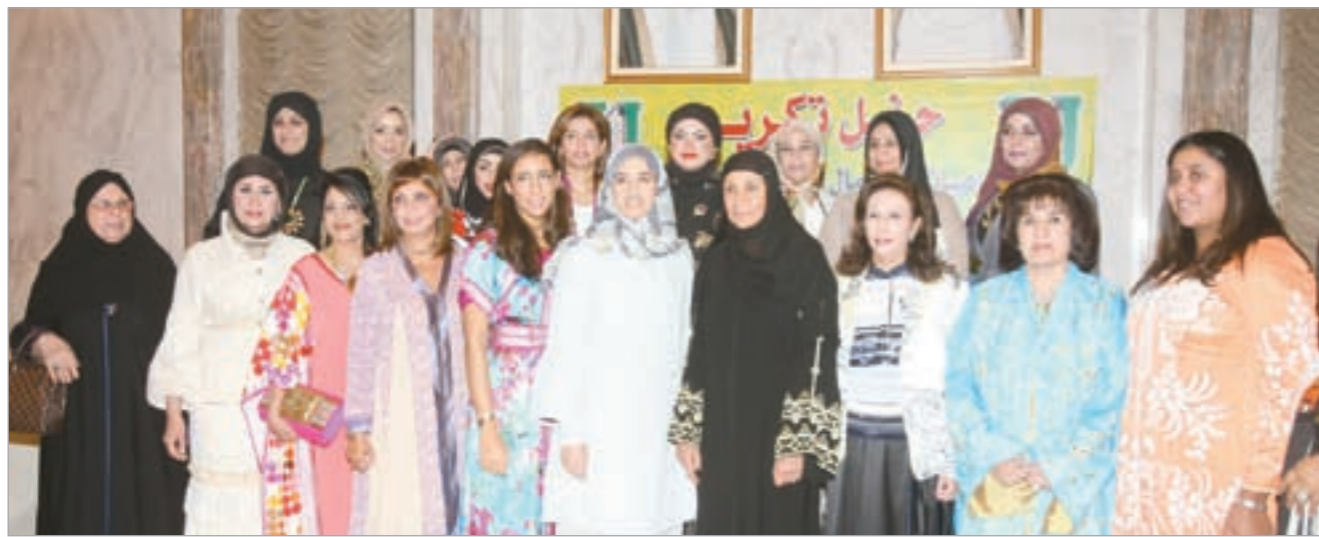
الشيخة لطيفة الفهد والشيخة شريفة الجاسم والشيخة عايدة سالم العلي والشيخة ديمونة الصباح يتوسطن الكرمات

كلام دارين العلي أعلنت رئيسة اتحاد الجمعيات النسائية ورئيسة الجمعية التطوعية النسائية الشبيخة لطيفة الفهد عن افتتاح مركز لتعليم النساء على الأعمال اليدوية قريبا يضم عدة نشاطات لتنمية وتوعية المرأة ثقافياً وأدبياً وصحياً وفي شؤون مختلفة.