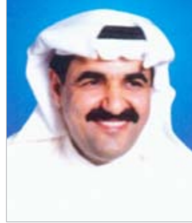
العميد ركن طيار علي محمد الفودري

كما يتطرق إلى دور المرأة الكويتية، ومشاركتها في المقاومة أثناء فترة الاحتلال الأثم، كما لها دور كبير في اثاره حماية الشباب والنساء للعمل ضد قوات الاحتلال وقيام المرأة بالمظاهرات ضد الخاصين الغزاة العراقيين.