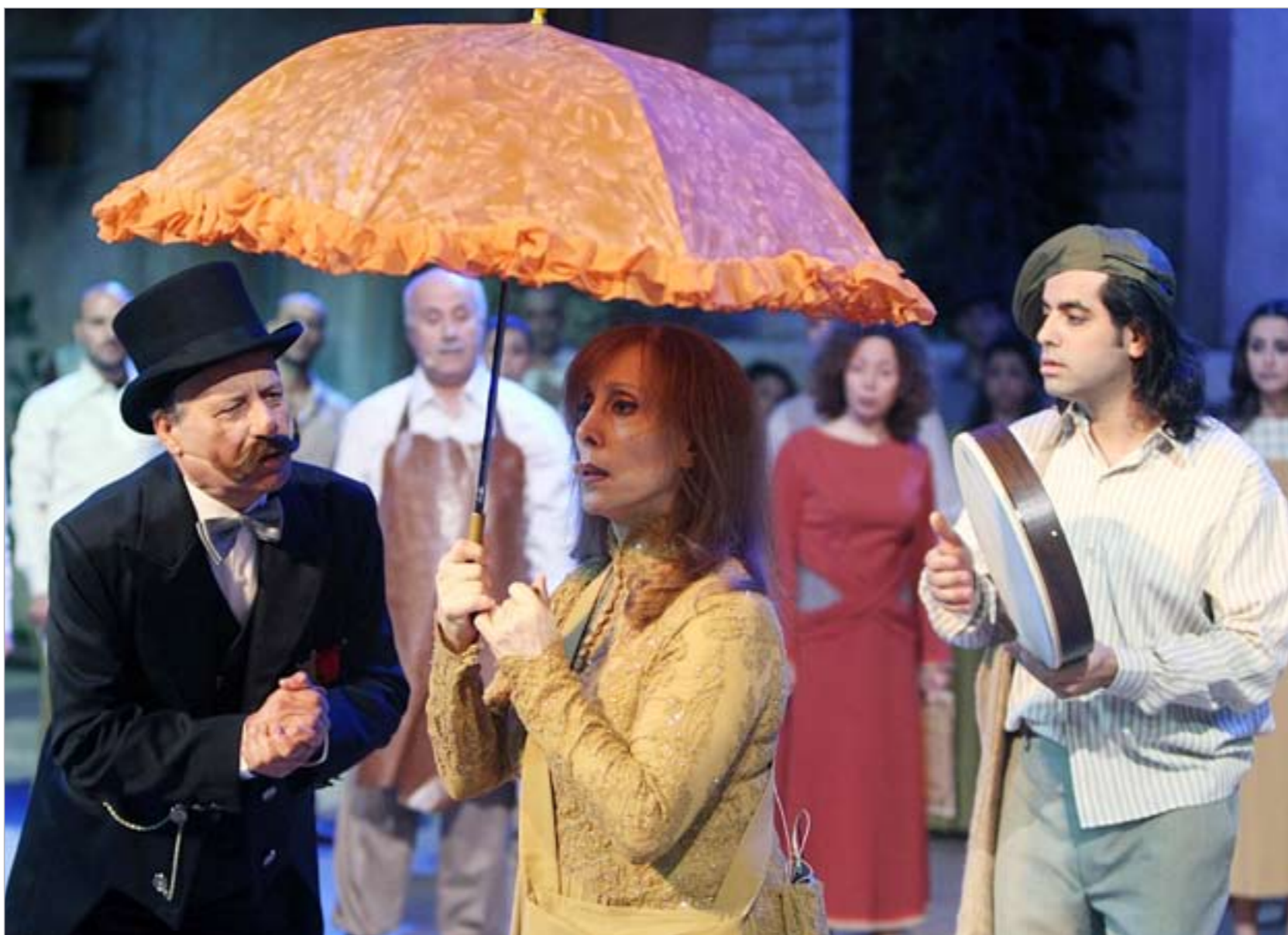
مشهد من مسرحية «صح النوم» خلال عرضها الأخير في دمشق

ويضيف البيان: يحاول البعض أن يشبع للرأي العام ان الدعاوى التي أقامها منصور هي من أجل منع فيروز عن الغناء، إن هذا الأمر غير صحيح على الإطلاق حيث ان منصور لم يرفض يوما طلبا لفيروز بأن تؤدي أيا من الأعمال المشتركة للأخوين الرحباني، إلا أن ما طالب به منصور بالمقابل كان أبسط حقوقه التي تنبع من المبدأ القانوني المكرس في المادة 6 من القانون رقم 1999/75 التي تحظر على أحد المؤلفين في الأعمال المشتركة أن يمارس بمفرده حقوق المؤلف من دون رضا شركائه ما لم يكن هناك اتفاق خطي مخالف وما يترتب عليها من حقوق، والتي مسا كان منصور لينكرها على