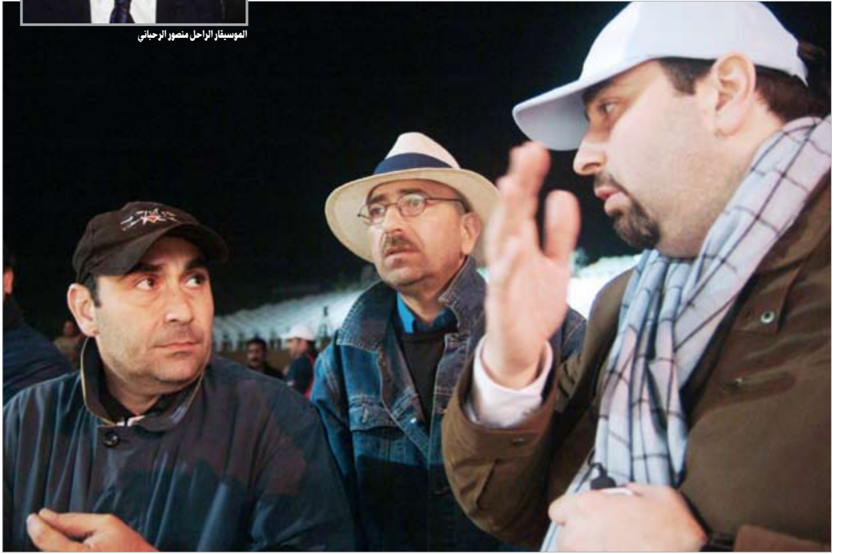
أبناء منصور الرحباني

بيروت - ندى مفرج سعيد تستعد بيروت لاحتضان ظاهرة صامتة 26 الجاري تضامنا مع فيروز بعد منعها من إعادة عرض مسرحية 'يعيش يعيش' على مسرح كازينو لبنان بسبب أمر قضائي حول ميراث عائلة الرحباني. بعد دعوى من قبل أولاد منصور الرحباني ضد فيروز. وقال منظمو الاعتصام انه سيكون سلميا صامتا لن يعطى فيه إلا أصوات أغنيات فيروز عبر مكبرات الصوت على أن يحمل المتظاهرون لافتات تنديد تعبر عن موقفهم من منع فيروز من الغناء.