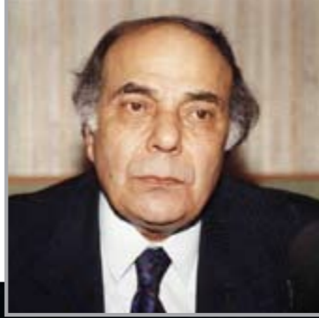
الموسيقار الراحل منصور الرحباني

وسيتم تنظيم الاعتصام السلمى أمام مبنى المتحف بوسط بيروت بعد أن حصل منظمو الاعتصام على تصاريح من وزارة الداخلية اللبنانية. وسيقوم المعتصمون بإرتداء قمصان صفراء، وهو اللون الذي تفضله السيدة فيروز. وقد أعلنت الفنانة المصرية إلهام شاهين أنها ستصل الى بيروت للتضامن مع المعتصمين. وقد خرج أولاد منصور الرحباني الذين يتعرضون لحملة إعلامية كبيرة لبنانيا وعربيا بسبب الغضب الشعبي من منع المطربة الكبيرة فيروز من الغناء بحكم قضائي، ووزع الاخوة الرحبانية الأولاد بياناً صحافياً جاء فيه: