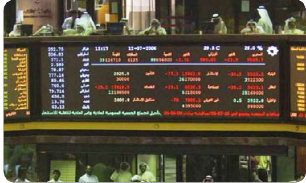
تذبذب السوق بين الارتفاع والانخفاض يشير الشك في نفوس المتداولين

وقد شغل قطاع العقار المركز الأول لجهة حجم التداول خلال الأسبوع الماضي، إذ بلغ عدد الأسهم المتداولة للقطاع 446,35 مليون سهم شكلت 35,07% من إجمالي تداولات السوق، فيما شغل قطاع الاستثمار المرتبة الثانية، حيث بلغت نسبة حجم تداولاته 21,51% من إجمالي السوق، إذ تم تداول 273,74 مليون سهم للقطاع. شغل قطاع البنوك المرتبة الأولى، إذ بلغت نسبة قيمة تداولاته إلى السوق 32,85% بقيمة إجمالية بلغت 57,41 مليون دينار، وجاء قطاع الخدمات في المرتبة الثانية، إذ بلغت نسبة قيمة تداولاته إلى السوق 28,89% بقيمة إجمالية 50,47 مليون دينار.