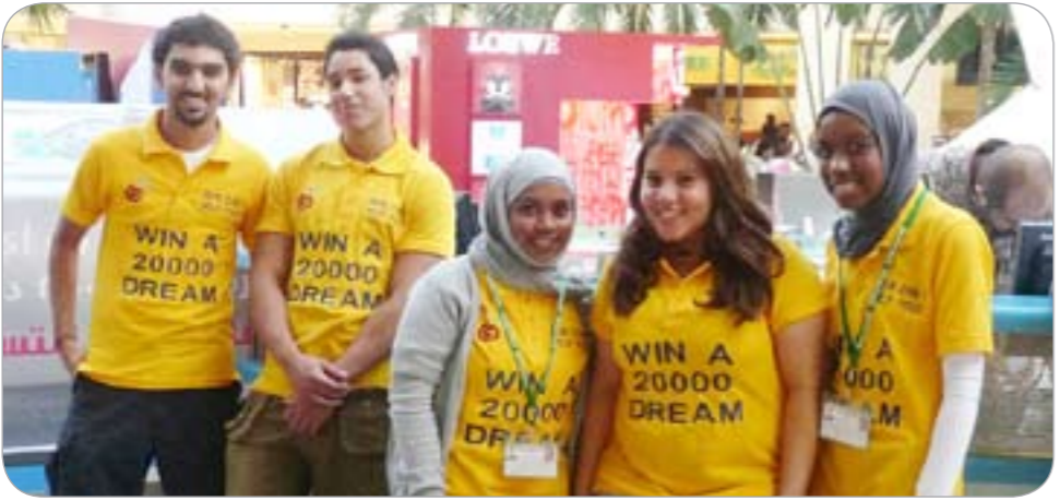
طلاب «لويك» المشاركون في البرنامج التدريبي

الوقت المخصص لذلك وضمان راحة الزوار، وهذا ما يتطابق مع رؤية المارينا مول بأن يكون سباقاً في تطبيق الوسائل التكنولوجية الحديثة التي تساعد رواده على الاستمتاع بوقتهم أثناء التسوق.