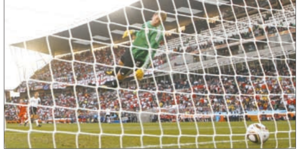
كرة لامبارد تجاوزت خط الرمي قبل أن يلتقطها نوير ويستأنف اللعب

للحكم بواسطة الفيديو على حادثة تثير الجدل امر مفالي.. ولم يتردد رئيس الاتحاد الاوروبي ميشال بلاتيني في ديسمبر الماضي في القول بان نظام التحكيم المتبع حاليا «مات» وهذا ما شجعه على اعتماد خمسة حكام في مسابقة دوري ابطال اوربوا الموسم المقبل بعد ان طبق هذا الامر في مسابقة «يوروبا ليغ» الموسم الماضي، كما سيعتمد خمسة حكام في كأس اوربوا 2012 ومن ضمنها التصفيات المؤهلة الى البطولة القارية. وكشف امين عام الاتحاد الدولي جيروم فالك بان الدفينا، يفكر في إمكانية استخدام 5 حكام (اثنين خلف الرمي)، لكنه لن يبحث مسألة اللجوء الى الفيديو.