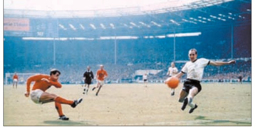
الإنجليزي جيف هيرست سجل هدفا مثيرا للجدل في رمي ألمانيا في مونديال 1966