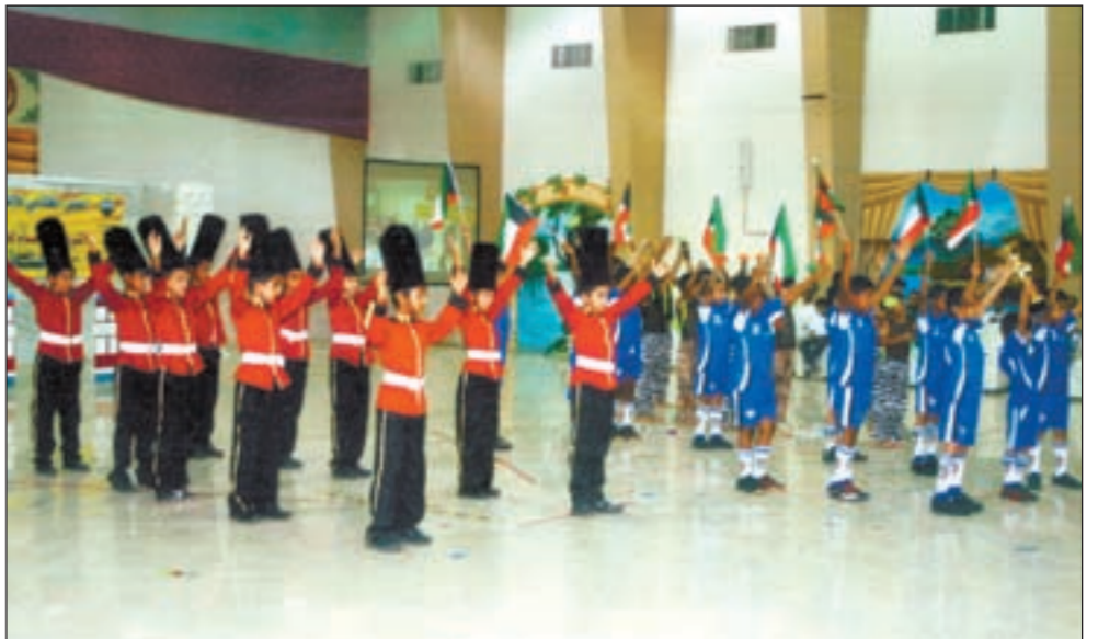
.. وجانب من فقرات حفل التكريم