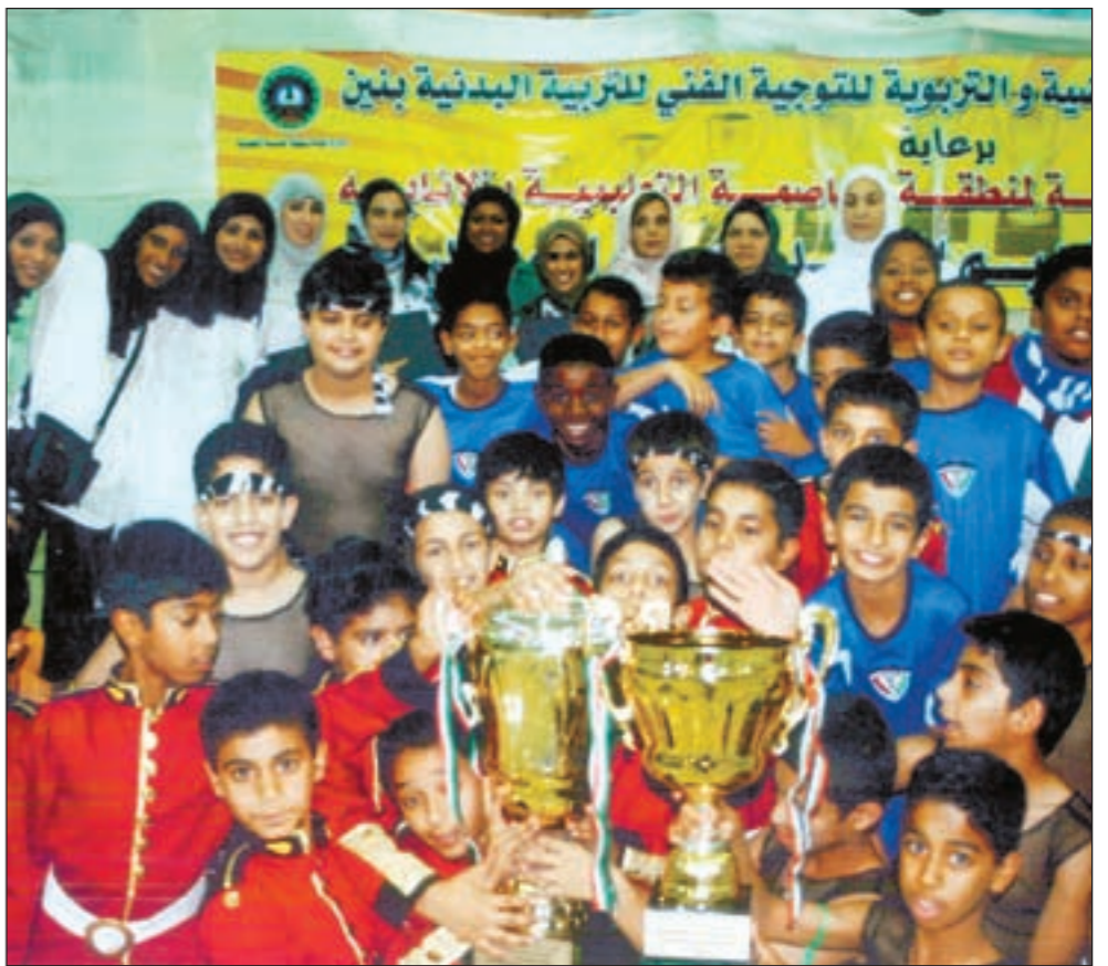
كأس التفوق العام لمنطقة العاصمة التعليمية