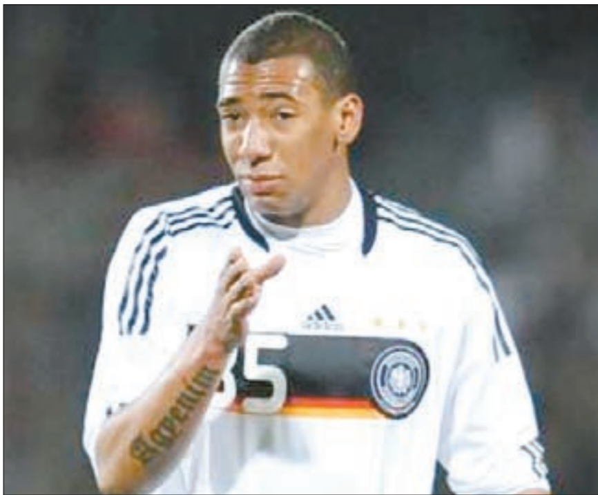
الألماني جيروم بواتينغ الاخ غير الشقيق للغانى كيغن برنس بواتينغ

كما لعب قايس (الثاني) للمنتخب التشيكوسلوفاكي في موندリアル 1990. ولم يشعر المدرب قايس بالقلق أبدا من إمكانية