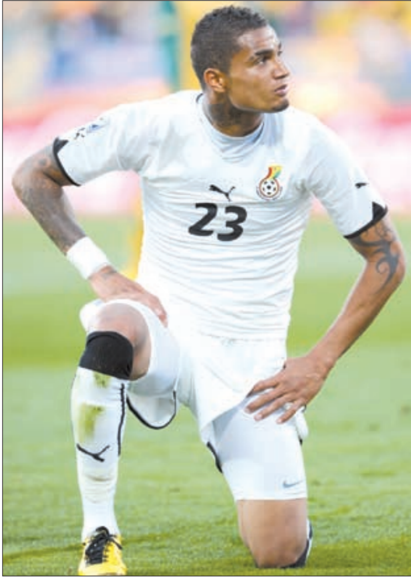
لاعب غانا كيغن برنس بواتينغ