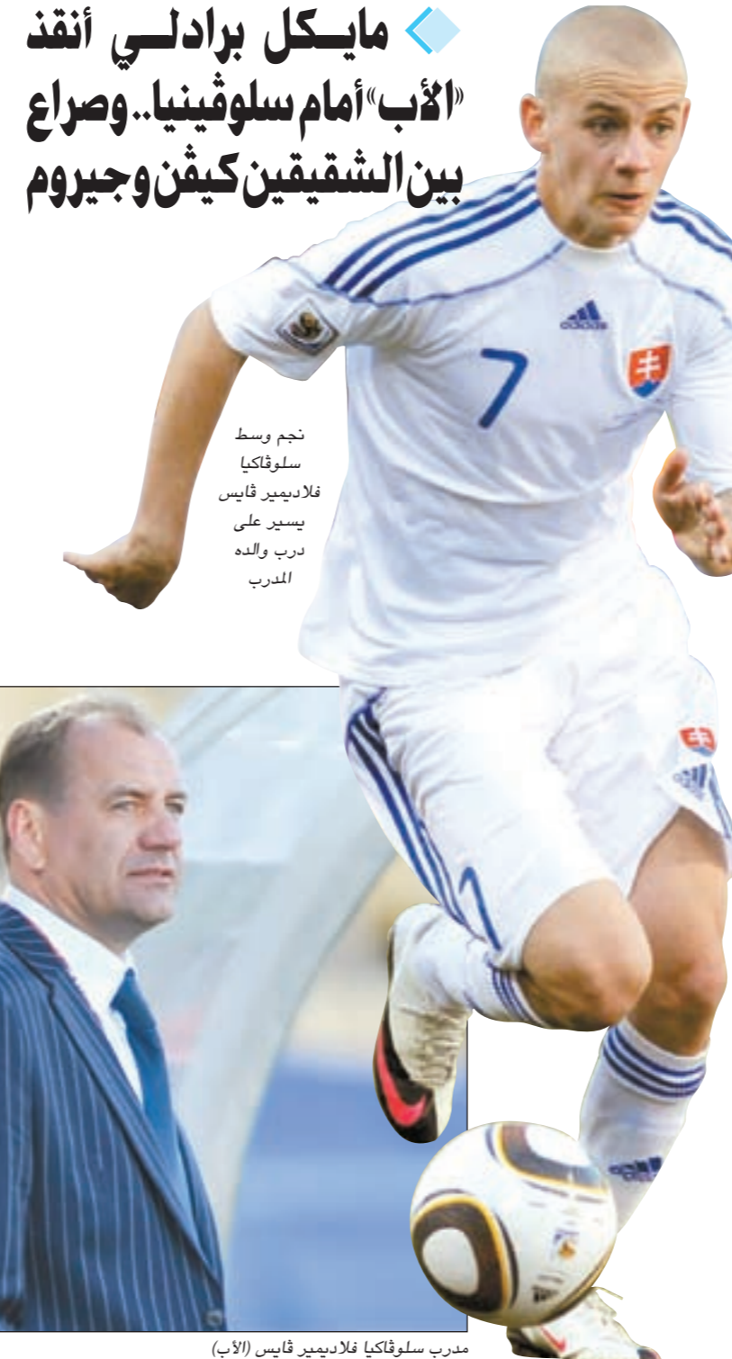
نجم وسط سلوفاكيا فلاديمير قايس يسير على درب والده