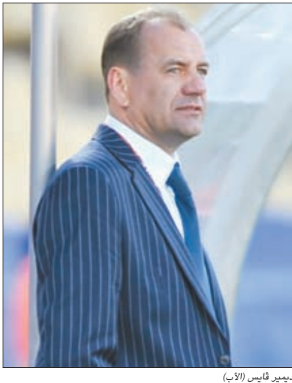
مدرب سلوفاكيا فلاديمير قايس (الأب)