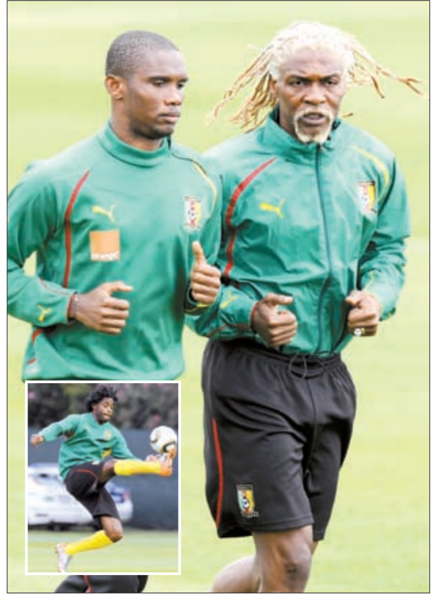
الأسد الكاميروني العجوز روجوبرت سونغ مع زميله صامويل ايتو وفي الإطار الكسندر سونغ

بالاسيوس المحترف مع هانغو غرينتاون الصيني بعد إصابة لاعب توريه الايطالي خوليو سيزار دي ليون «راميو» بتمرق عضلي تشيلي في المجموعة الثامنة. وينحدر الأشقاء الثلاثة من بلدة «لا سيبا»، وجيري هو الشقيق الأكبر بعمر 29 عاما، يليه ولسون 26 عاما المحترف مع توتنهام الانجليزي ثم جوني 24 عاما لاعب فريق اولمبيا المحلي.