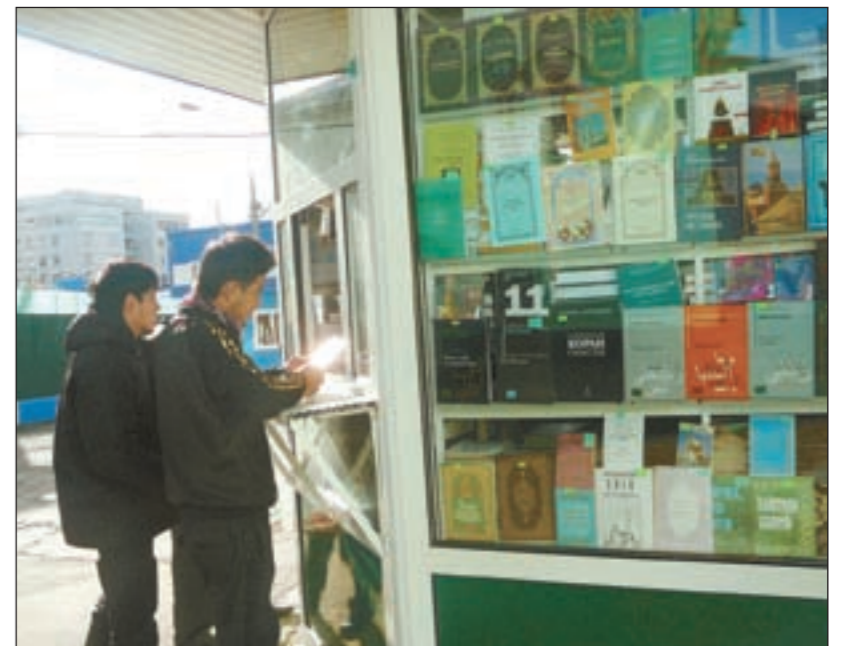
مكتبة إسلامية تضم مصاحف وكتب التفسير والسيرة النبوية