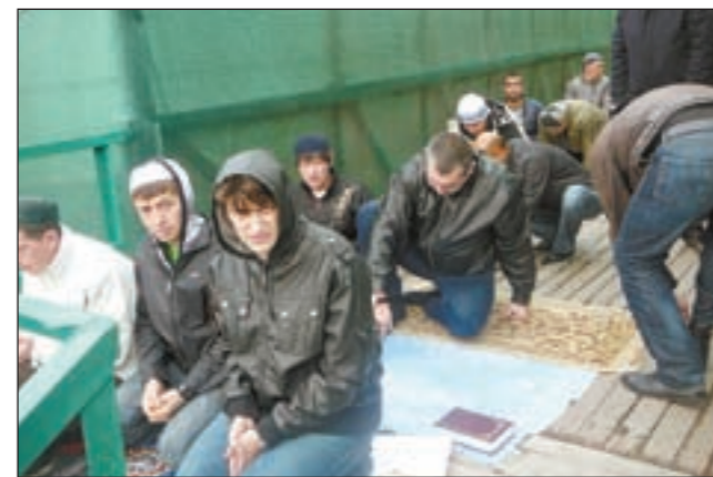
برودة شديدة وصلاة في الشوارع

الضيق للإسلام. أخيراً رسالتكم للشعب الكويتي والعربي والجمعيات الخيرية في الكويت والدول الإسلامية؟ نقول لإخواننا في العالم الإسلامي انه ربما تفرقنا حدود دولنا ولكن يوحدنا ديننا ونسعى إلى والتسامح والمحبة لأن الجهل هو أكبر المشكلات وهو الذي يسبب التطرف والغلو، والإسلام أوسع مما يتصور هؤلاء الناس، ونعمل جنباً إلى جنب مع مفتي مناطق قوقاز المنطقة التي تعاني من عمليات التطرف والغلو وأساسها التصور