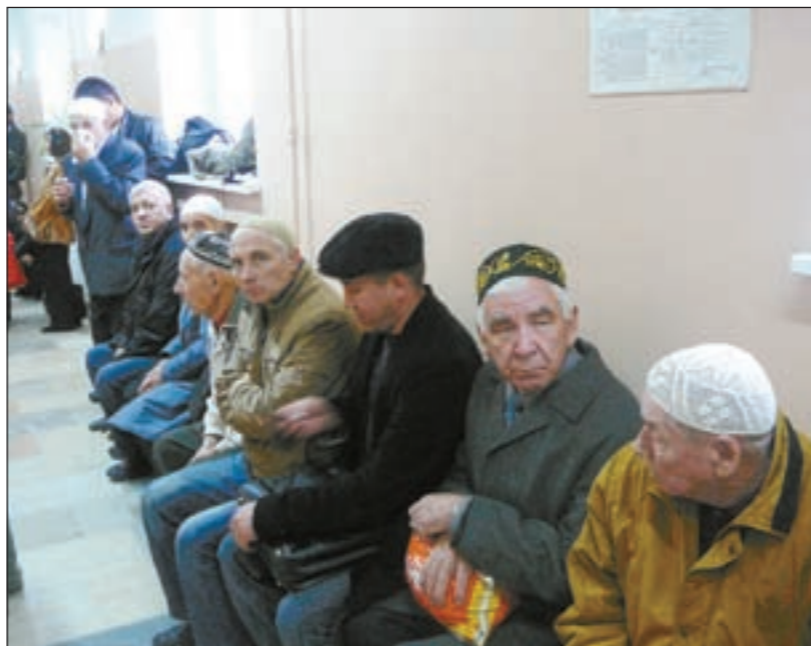
مسلمون روس يصلون الجمعة في طرقات الإدارة الدينية احتفاءً من البرد الشديد