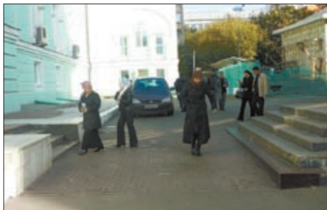
مسلمات روسيات في طريقهن للمسجد

ولكن تبقى قضية الحيادية، كيف تتعاملون في إعلامكم بهذه الحيادية تجاه قضايا كالنوروي الإيراني والاحتلال الإسرائيلي وغيرها؟ «روسيا اليوم» تقدم منبراً محايداً من العرب للعرب بمختلف الفئات والأحزاب والحركات والدول فمثلاً في لبنان جماعة الحريري والمستقبل لا يظهرون في «المنار» وجماعة حزب الله لا يظهرون في «المستقبل» ولكنهم جميعاً يظهرون في «روسيا اليوم» وهو ذات الموقف لبعض الحكومات من دول أخرى مجاورة لها في المنطقة العربية وهذا جرح لا أريد الحديث عنه. ولكن البعض يرى ان لكم أجندة سياسية خاصة في «روسيا اليوم»؟ ليس لدينا أي أجندات مخفية، فروسيا اليوم ليست لديها أي أجندة سياسية ولا اجتماعية