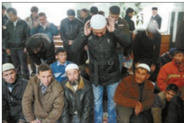
تزامم من أجل الصلاة

على نشر مفاهيم ديننا التي هي سبب عزنا في الدنيا وسعادتنا في الآخرة. وأنتني لا يبقى رجاؤنا دون اهتمام الجمعيات الخيرية ونحن مستعدون للعمل المشترك وانتظركم ضيوفاً كراماً في روسيا الاتحادية. صديقة الإسلام والمسلمين.