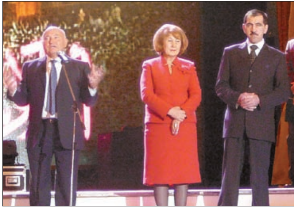
عمدة موسكو يتغنى بحبه للمسلمين في حضور رئيس انغوشيا يونس بك

◆ لا بد أن يكون في كل مقاطعة من مقاطعات موسكو وسابزل قصاري جهدي لتحقيق ذلك