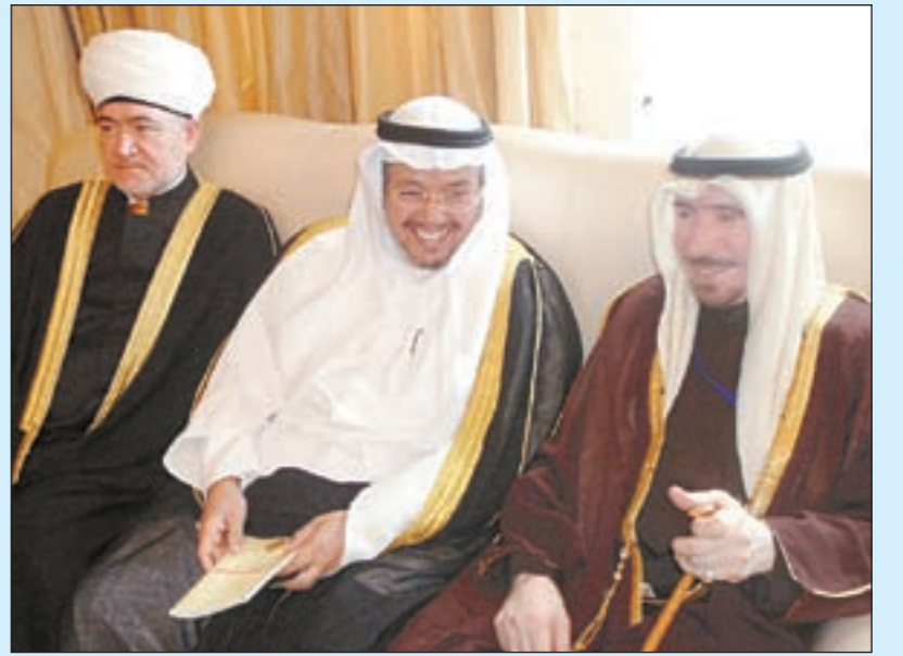
د. عادل الفلاح مع مستشار رئيس دولة الامارات للشؤون الدينية والشيخ راوي عين الدين

موسكو - أسامة أبو السعود كانت البداية من العاصمة الروسية موسكو وكان ختامها أيضا في موسكو. والمسافة تقاس داخل الاتحاد الفيدرالي الروسي بألاف الكيلومترات حيث تبلغ مساحة روسيا اليوم أكثر من 17 مليون كيلومتر وهي كما يطلق عليها البعض - قارة بأكملها - فهي أكبر دولة في العالم من حيث المساحة وتوزع أراضيها بين قارتي أوروبا وآسيا. وتمثل روسيا جسرا بين القارتين. ومن بين 146 مليون مواطن روسي يوجد قرابة 26 مليون مسلم ويشكل الدين الإسلامي في روسيا الديانة الثانية من حيث عدد السكان بعد الدين المسيحي حيث دخل الإسلام سيبيريا عام 822م وامتد الحكم الإسلامي المغولي والعباسي هناك لسنوات طويلة. وتركز المسلمون في القوقاز الروسي كله في سيبيريا وموسكو. وأقلية في ساسخا-ياقوتيا وغرب روسيا. ويركز بعض الروس ان الديموغرافيا السكانية هي لصالح المسلمين الذين يتكاثرون بشكل كبير بينما يفقد المجتمع الروسي سنويا أكثر من 500 ألف مواطن بسبب خمول النفودكا وغيرها والتي تسبب في حوادث كثيرة على الطرق وهو ما حدا للرئيس الروسي الأسبق ورئيس الوزراء حاليا فلاديمير بوتين على إصدار قرار يمنع شرب النفودكا في الأماكن العامة للحفاظ على أرواح مواطني بلده متبعاً في ذلك تحريم الخمر في الدين الإسلامي لما تحدثه من ذهاب للعقل علاوة على حالات الانتحار سنويا. في موسكو كان لابد من لقاء زعيم المسلمين هناك وهو رئيس مجلس المفتين في روسيا المفتي راوي عين الدين ويستحق هذا الرجل ان يلقب بموحد كلمة المسلمين في روسيا. فبعد ان كانوا مشتتين في العهد السوفييتي السابق ولم تكن لهم أي كلمة مسموعة أصبح حكام روسيا