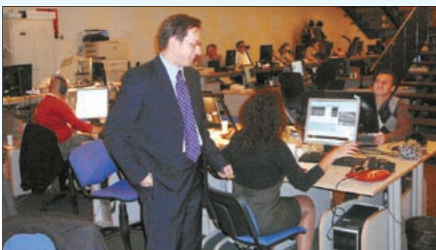
أغانين يتفقد سير العمل داخل احد استديوهات RT

لاتزال هناك بعض العمليات والتفجيرات ضد الدول الروسية المستقلة ومنها عمليات في الشيشان وداغستان وغيرها، ما جهودكم للتصدي لتلك العمليات باعتباركم أكبر زعامة دينية في روسيا؟ جهودنا في مواجهة التطرف والغلو التي ظهرت في بعض مناطق روسيا في السنوات الأخيرة تركز على أساس العمل على انتشار التعليم الإسلامي الصحيح في الدولة وبناء على هذا نفتح المدارس والمعاهد الإسلامية ونقوم بطباعة الكتب ونشر مفاهيم الوسطية