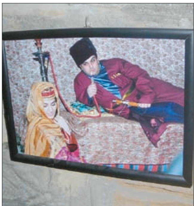
عمر شهريار.. لوحة تذكارية داخل قلعة العذراء