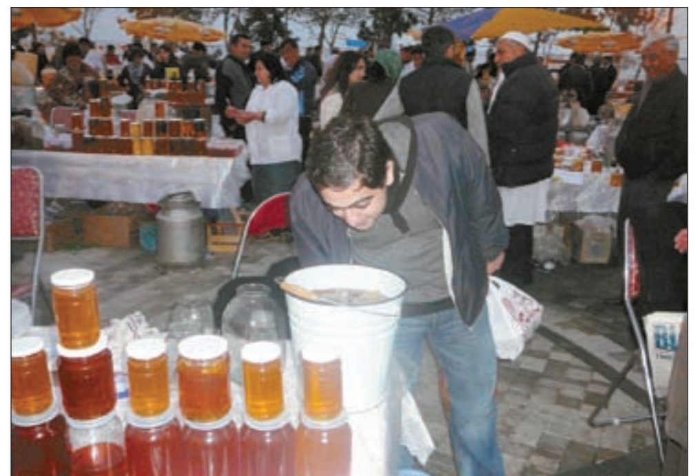
أشهى أنواع عسل النحل وأجودها عالمياً في معرض سنوي على شواطئ باكو