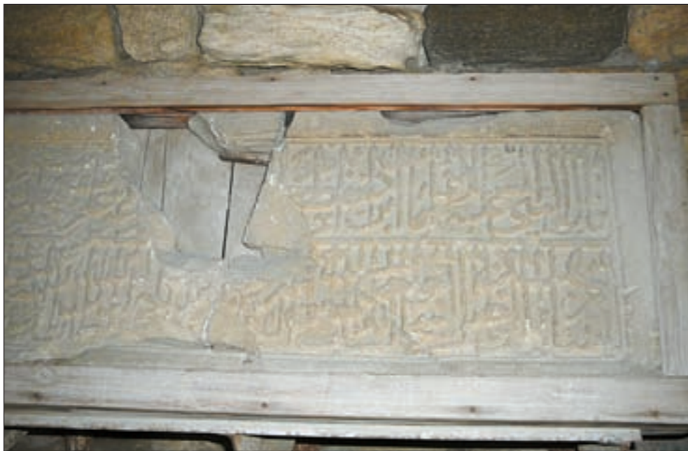
أحد المعالم الأثرية للمسلمين القدماء في أذربيجان

وتعيش أذربيجان وبخاصة باكو وسط غابة من الاساطير والحكايات التاريخية وخاصة عن قصص الحب والغرام والعشق والعشاق، فهنا قلعة العذراء التي تحكي قصة عذراء سجنها ابوها في تلك القلعة على بحر قزوين حتى لاترى حبيبها لانه من عامة الشعب فما كان منها الا ان القت بنفسها من اعلى القلعة التي ترى من اعلاها باكو من شمالها لجنوبها ومن شرقيها لغربها وتتميز بطراز فني رائع في بناؤها من الخارج والداخل. وليست تلك القصة الوحيدة عن العشق والغرام فهناك عشرات بل مئات القصص في بلد يقال ان حاكمه كان شهريار وقصته المعروفة مع شهزاد في الف ليلة وليلة المشهورة في بلادنا العربية والفت فيها عشرات القصص، وهناك ايضا قصة الشاعر الذي خطف حبيبته على فرسه الابيض وحلق بها الى السماء وهم ينسجون حول تلك القصص العديد من ابيات الشعر وتنقشها ايدي البقية ص 27