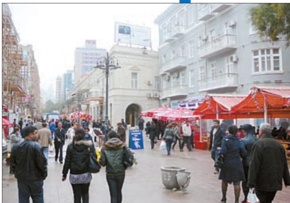
شوارع باكو مليئة بالحركة والجمال

و بعد تعيينه في هذا المنصب وصل حذيفة بن اليمان من نهاوند الى اردبيل التي كانت مدينة اساسية