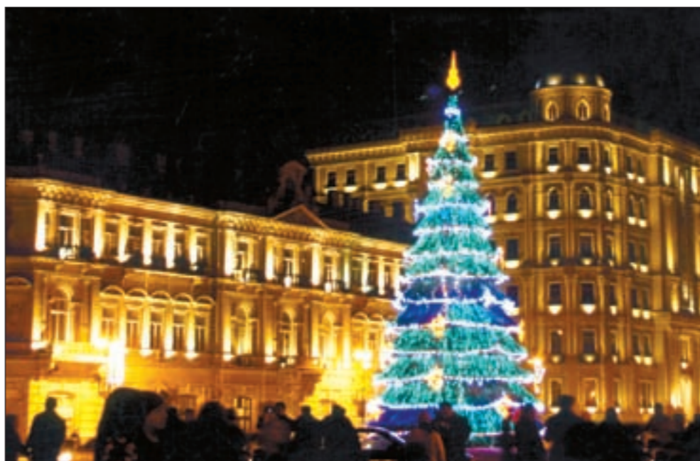
باكو تعيش نهضة حضارية متميزة

ورغم ذلك إلا أن أذربيجان اليوم بلد لا يعرف المذهبية الطائفية الضيقة ويتعايش جميع أبنائه من المسلمين «سنة وشيعة» والمسيحيين واليهود في وئام تام فلم تشهد البلاد مثلاً في أعقاب انهيار الاتحاد السوفييتي أي حادث طائفي أو عرقي أو ديني وهو ما يؤكد حقيقة التعايش في هذا البلد الجميل بأهله وقيادته.