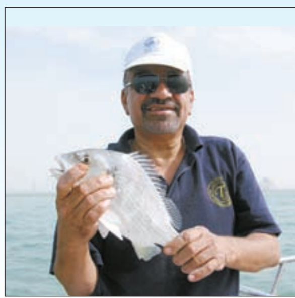
وهذا احلى شعم