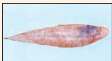
سمكة لسان الثور

هي سمكة رقيقة اللحم، الجسم مضغوط، شكلها يشبه قوسين متعاكسين، ملساء الملمس، اللون بني مائل للاحمرار، البطن وردي شفاف، العينان فوق الرأس من جهة الظهر، وفوق الفم ترافق الروبيان أو أنها تقع مع الروبيان في أثناء عملية الجر وهي غير مرغوب فيها.