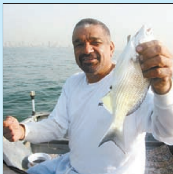
صور بالحبيب مالشعم الطيب