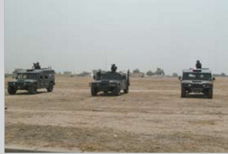
كليات القوات الخاصة تستعد لشن الهجوم