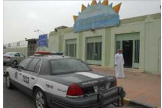
تواجد امثي مقابل المدرسة التي شهدت ساحتها الخارجية الجريمة

رواح وضياح مستقبل الحدث الآخر منفذ الجريمة واهتران قيم المجتمع ما قد يجعل من الحادث شرارة قد تتسبب في حريق أكبر. وأشارت الى ان المشاجرة تمت بين الطالبة بمدرسة عبدالله مشاري الروضان بمنطقة القصور بعد انتهاء الدوام المدرسي والتي نتج عنها وفاة طالب في الصف الثامن من المرحلة المتوسطة. والطالب المتوفي تلقى طعنة واحدة نافذة الى القلب مباشرة من طالب في المرحلة الدراسية ذاتها وتقوم وزارة الداخلية حالياً بالتحقيق للتعرف على ملابسات الحدث وحيثياته.