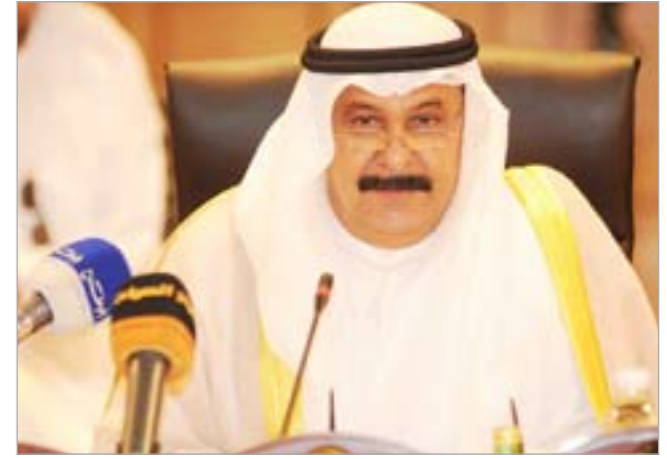
الفريق غازي العمر

الاولية افادت بهرويه في سيارة «همر» كانت بانتظاره امام المدرسة بعد ارتكابه جريمته. هذا وقد افاد شهود عيان لـ «الأنباء» أمس، وبينهم مواطن رفض ذكر اسمه، بأن سيارة من نوع «همر» كان بداخلها شاب يبلغ من العمر نحو 25 عاماً وقفت امام المدرسة ونادي سائقها الطفل المجني عليه فاقترب منه، وعند اقترابه خرج القاتل من المدرسة حاملاً سكيناً من بين ملبسه المدرسية وسدد الطعنة القاتلة الى قلب الضحية، ثم ركب السيارة وعاد وخرج منها ليخاطب المجني عليه والذي كان غارقاً في دماؤه ويقول له «انا الآن ذاهب الى ... والربال يجيبيني من هناك».