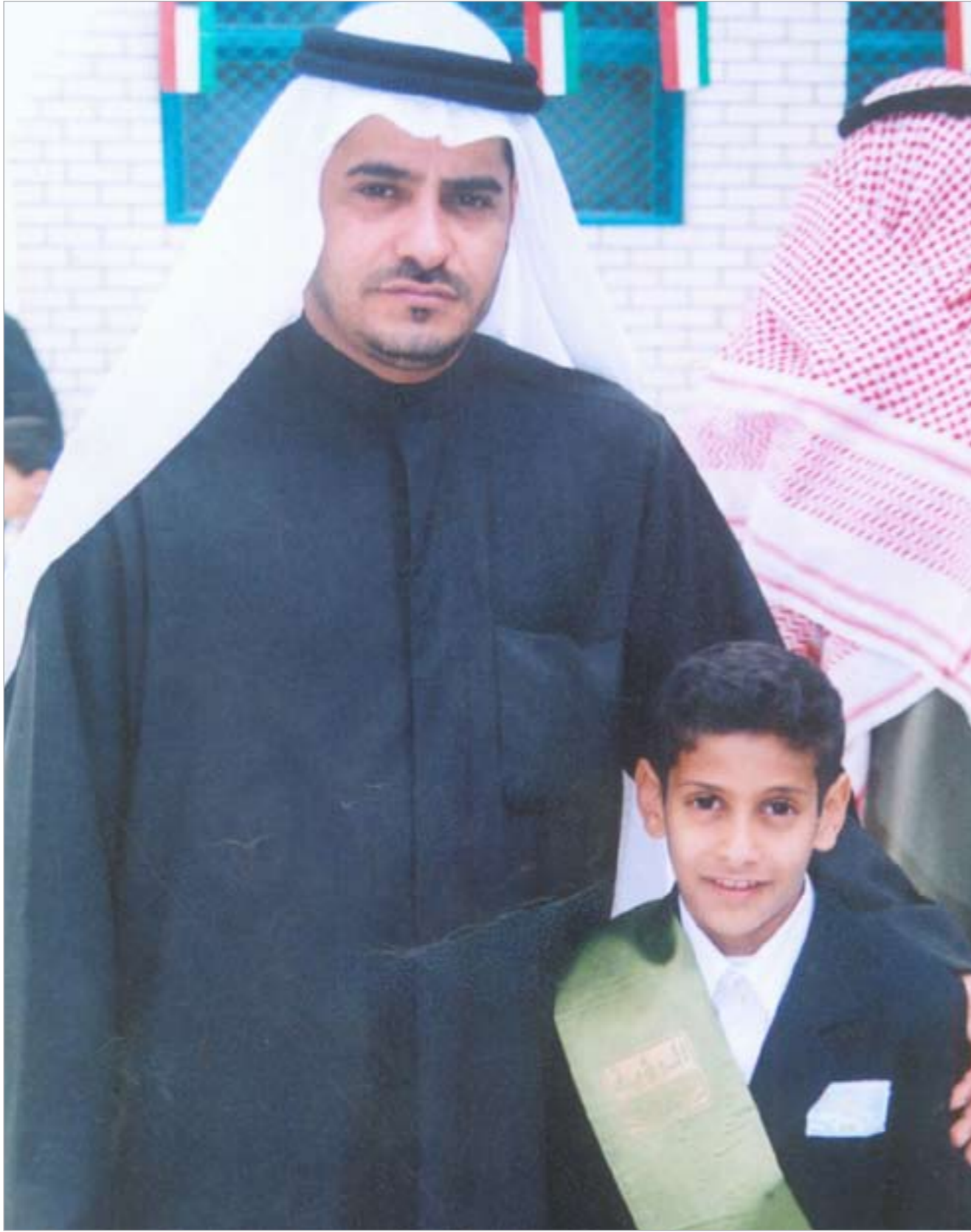
والد القتيل وابنه الضحية في صورة عقب حفل تكريم المتفوقين