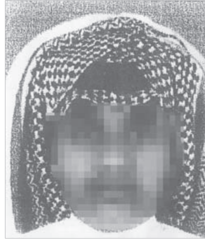
صورة القاتل عممت على المنافذ البرية والجوية