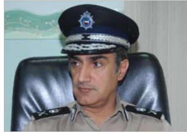
مدير أمن محافظة مبارك الكبير بالإنابة اللواء إبراهيم الطراح