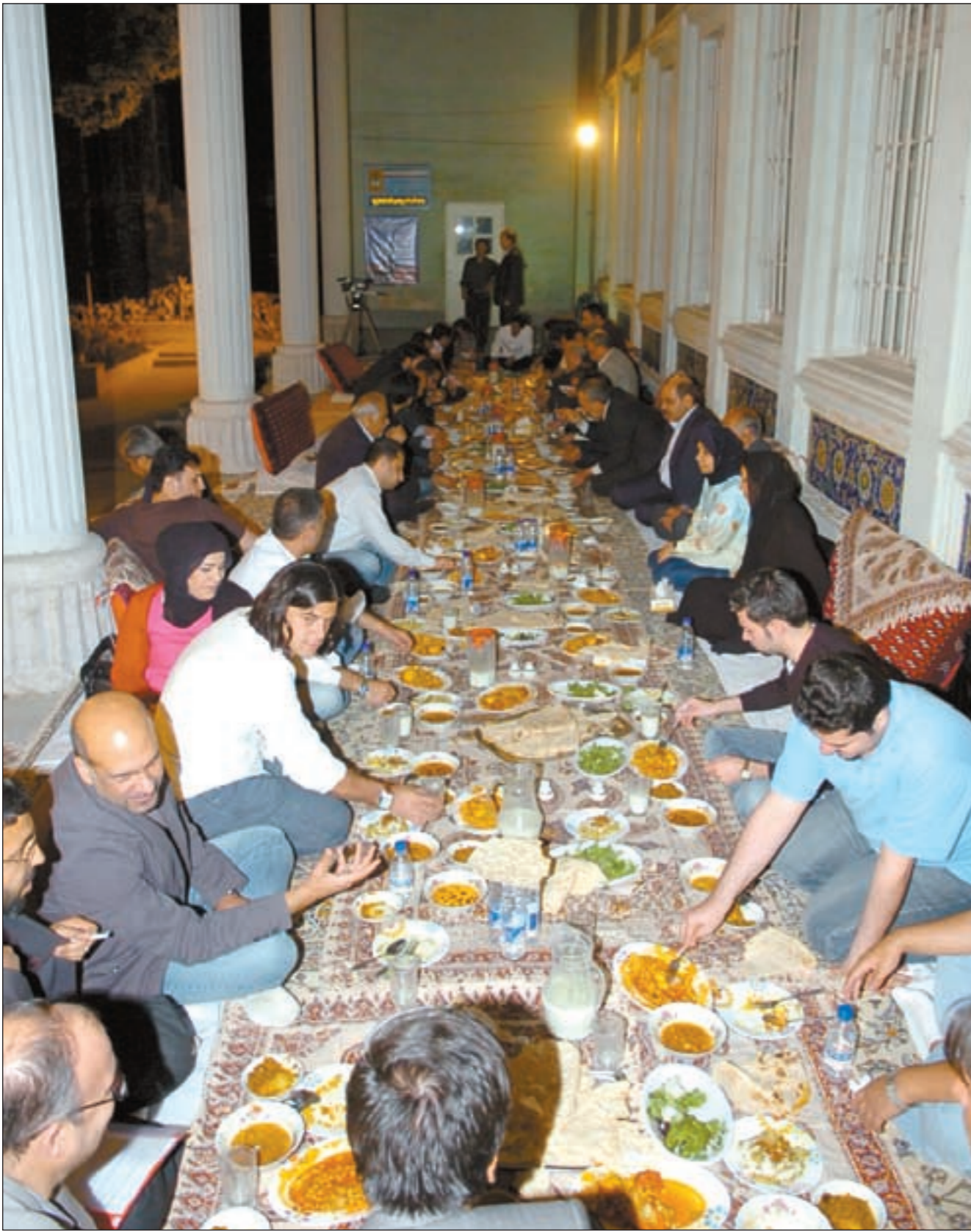
جانبا من مائدة العشاء تكريما للوفد الإعلامي الكويتي في معهد الفنون الجميلة