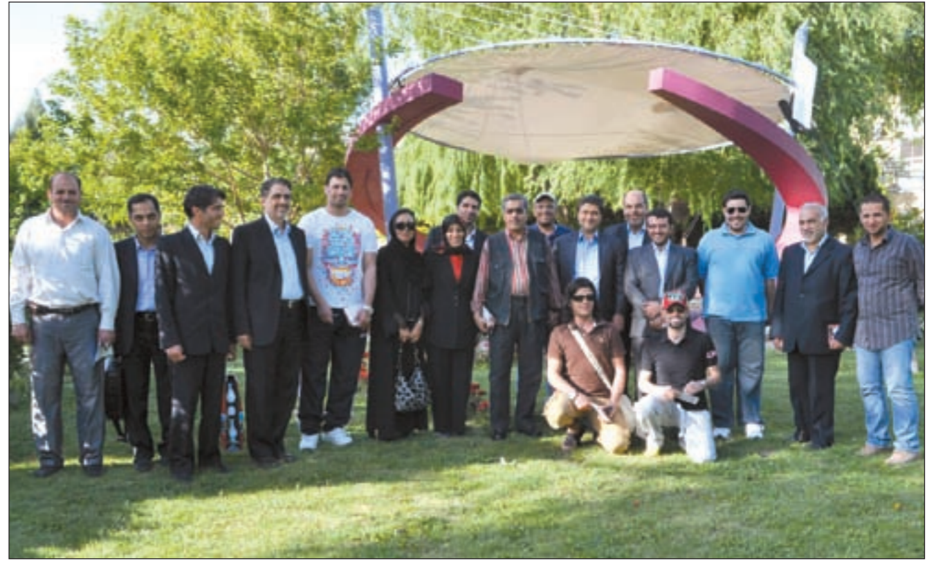
مدير تلفزيوني وإذاعة أصفهان مع الوفد الإعلامي الكويتي