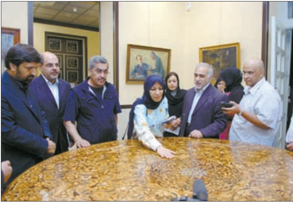
أعضاء الوفد الكويتي أمام إحدى المقتنيات الثمينة في معهد الفنون الجميلة