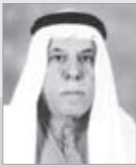
إعداد: منصور الهاجري

"من الماضي" صفحات مضيئة مشرفة نفتحها معكم يوم السبت من كل أسبوع نونفها لكم بشهادات وأسرار وذكريات كويت الماضي مع رجالاتها الأوائل الذين عاشوا الفترتين ما قبل النفط وما بعده. نحاول كل أسبوع أن نعيد رسم كويت الماضي مع ضيوفنا ونسير أغوار ذاكرتهم المملوءة ببق الماضي والزمن الجميل. صفحات "من الماضي" ليست أكثر من محاولة لإعادة كتابة الزمن الجميل بالأسنة من عاشوا ذلك الزمان والذين يرددون دوماً "عتيق الصوف ولا جديد البريسم".