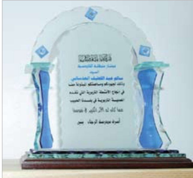
.. وشهادة تقدير أخرى