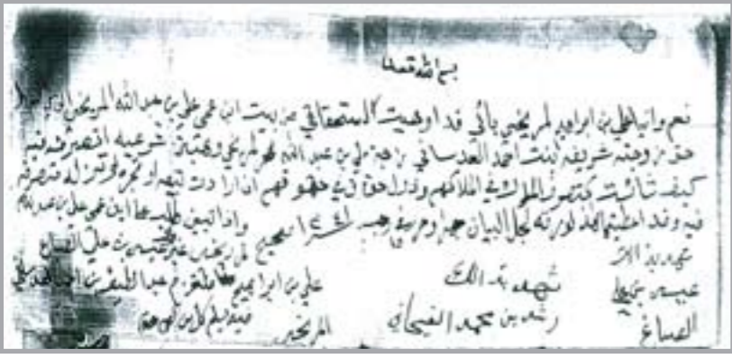
وثيقة بيع بين علي المريخي وشريفة بنت احمد العسائي