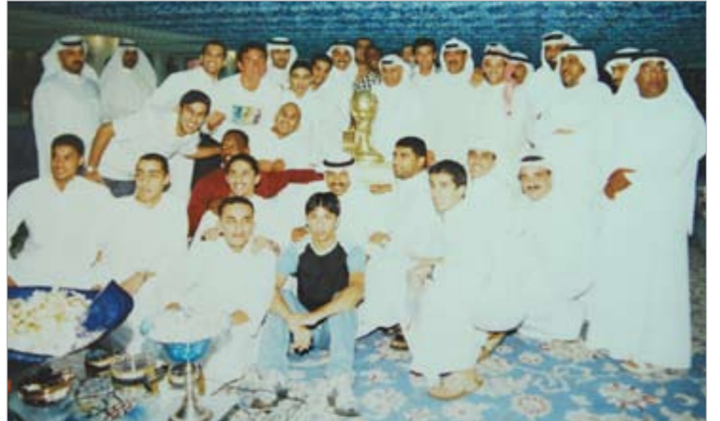
مجموعة من لاعبي واداري نادي القادسية بعد الفوز بكأس صاحب السمو الامير