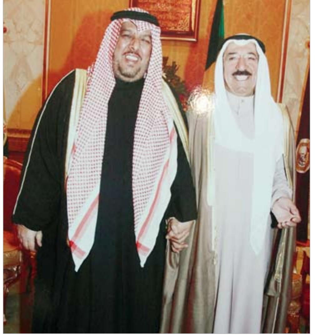
صاحب السمو الامير الشيخ صباح الاحمد مع مختار القادسية